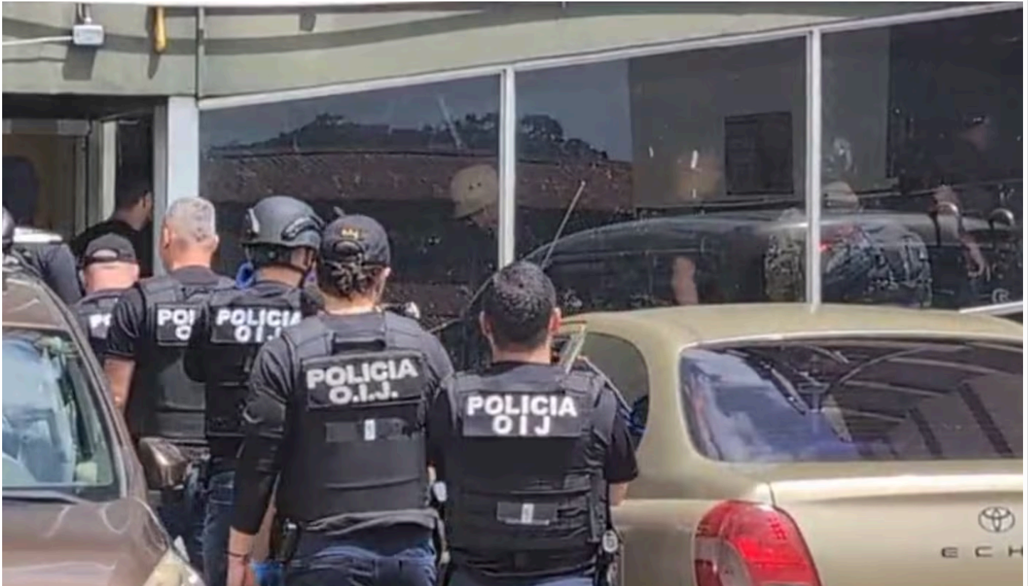
Los agentes buscaban en total a 11 personas. (OIJ/Operativo para detener a banda Los Orientales.)

¿Pagar más implica una mejor nota de admisión a la UCR, el TEC o la UNA entre los colegios privados con calificaciones más altas? Aquí la respuesta