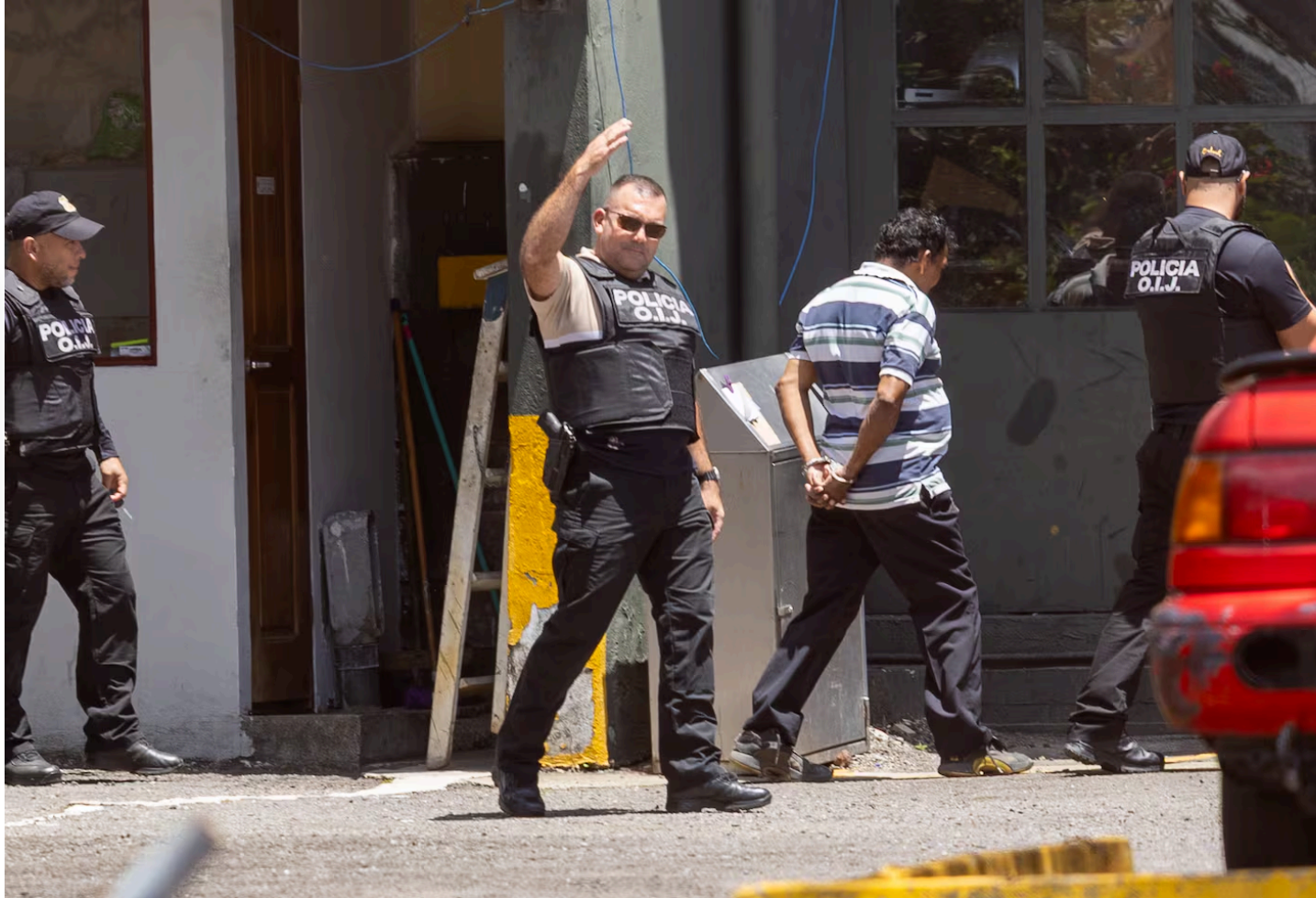
Este fue uno de los cuatro detenidos este martes.

La Fiscalía indicó que los sospechosos traían mujeres desde Venezuela bajo la promesa de que trabajarían como generadoras de contenido. Les cubrían todos los gastos de traslado (entre $3.000 y $5.000), a cambio de que una vez en Costa Rica las víctimas ofrecieran servicios sexuales para pagar la deuda del traslado.