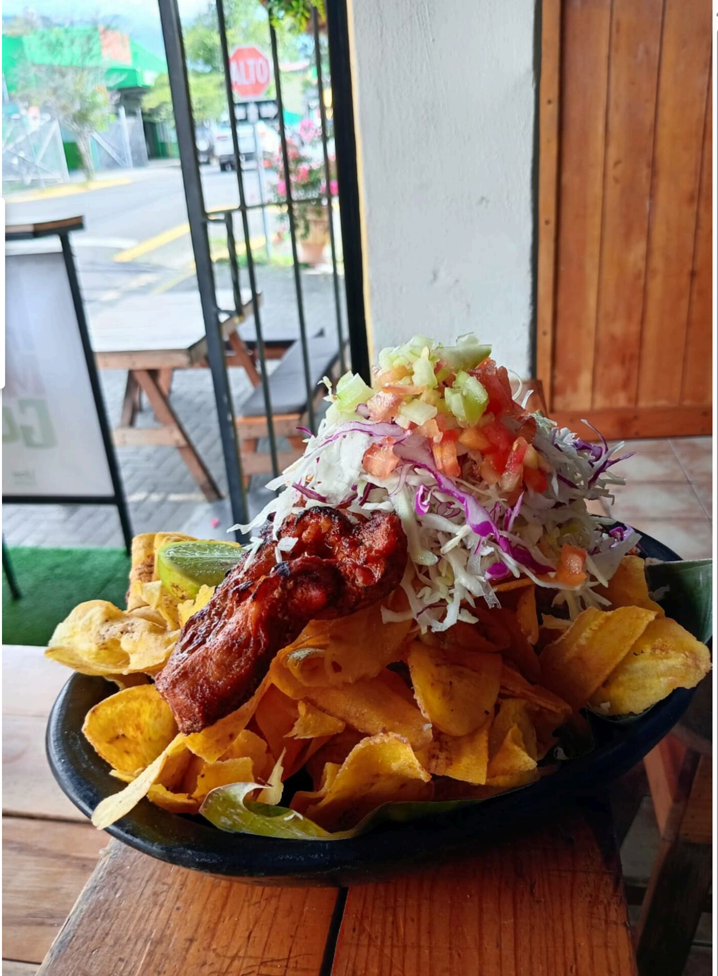
Tiene que ir a probar estas delicias.