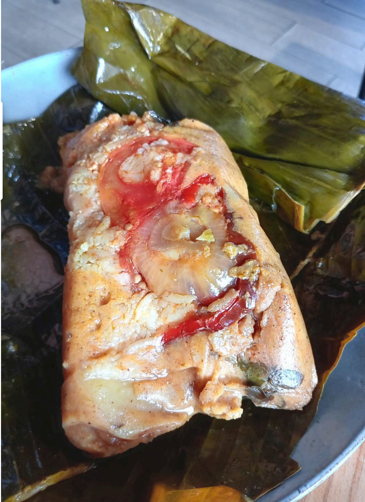
Los nacatamales le quedan deliciosos.