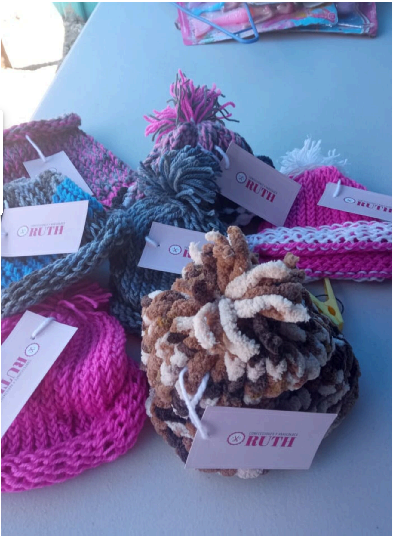
Estos gorritos también son creación de doña Rut.