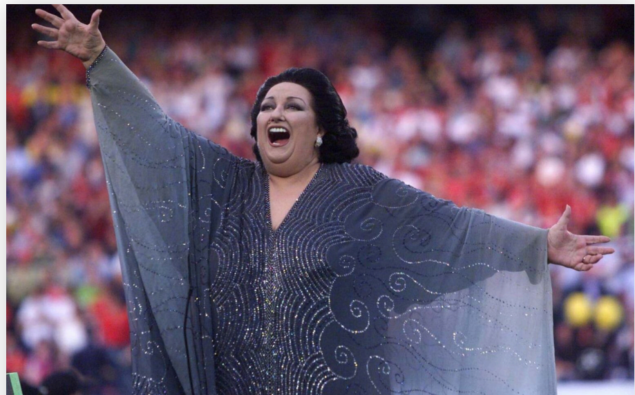
Montserrat Caballé fue la gran diva de la ópera española en el siglo XX y será recordada en la voz de su hija el próximo 19 y 20 de abril en el Teatro Nacional.

El próximo 19 y 20 de abril, en el Teatro Nacional, apunta a que se dará un juego de espejos en las voces de Montserrat Martí Caballé, hija de la diva española Montserrat Caballé; y Simona Todaro Pavarotti, nieta de Luciano Pavarotti, en un espectáculo que pretende convertirse en una noche de altos vuelos.