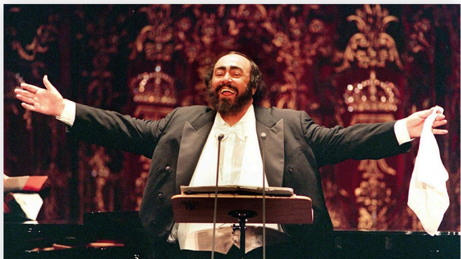
Luciano Pavarotti fue el gran tenor italiano del siglo XX. En Costa Rica se presentó el 31 de enero de 2004.

A ese abuelo que recorrió el mundo con su inconfundible voz y que se dedicó en cuerpo y alma a su arte, es al que recordará Simona Todora Pavarotti en su presentación en el Teatro Nacional.