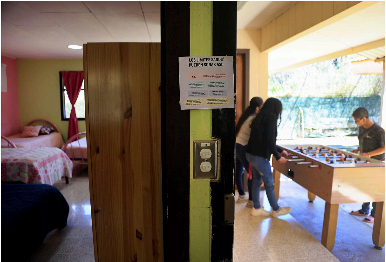
En las montañas de Coris, en Cartago, funciona el centro de rehabilitación Renacer, el sitio es exclusivo para mujeres menores de edad con dependencia a sustancias psicoactivas. (Rafael Pacheco Granados)