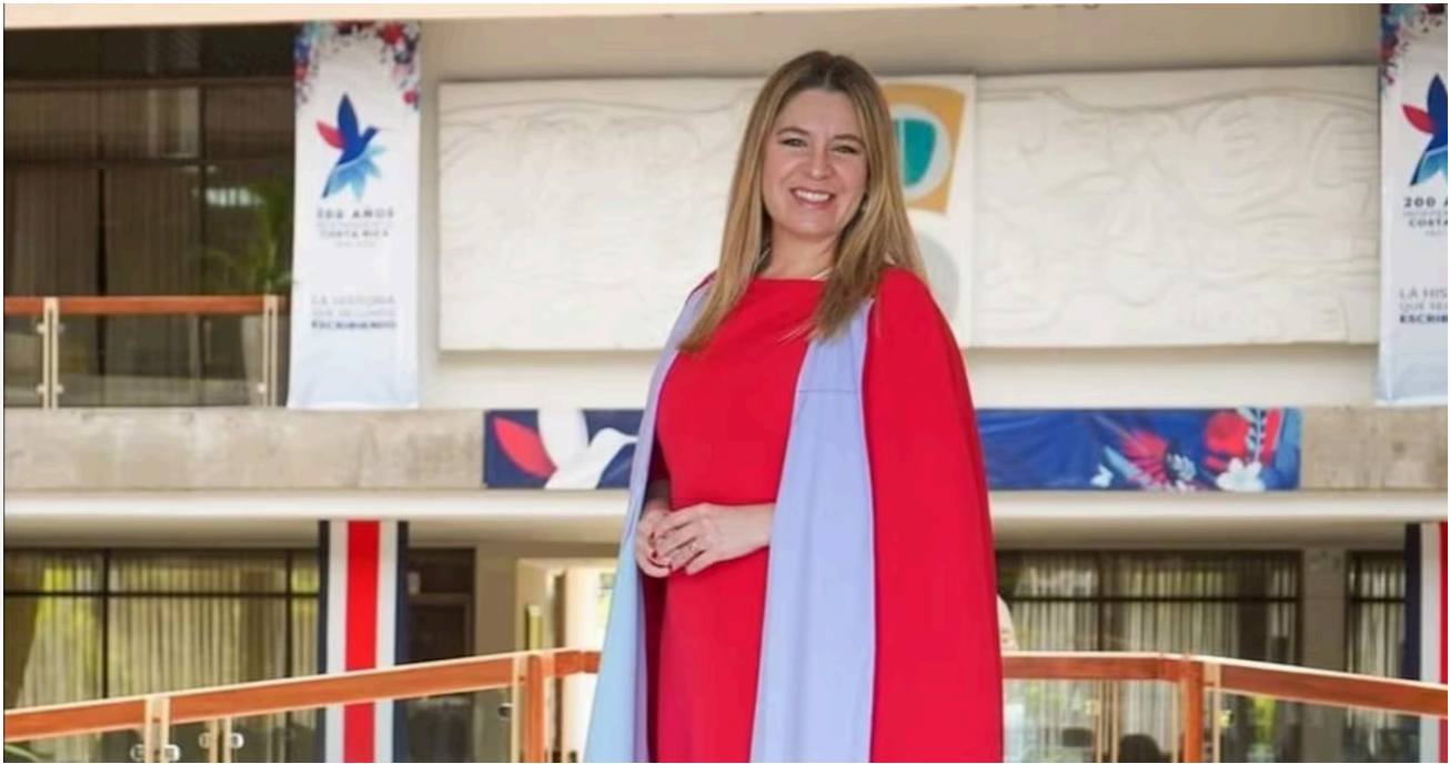
Claudia Dobles estará buscando la presidencia con el partido Acción Ciudadana.

A través de sus redes sociales, la ex primera dama dio a conocer que será precandidata por el Partido Acción Ciudadana (PAC).