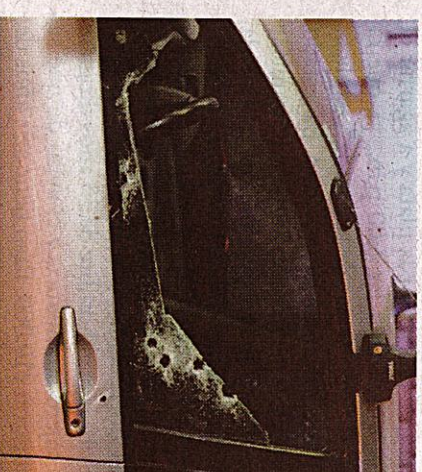
Un hombre fue asesinado a balazos en Pérez Zeledón mientras viajaba en un auto.

Andrés Ulloa Montero andres.ulloa@gruppoextra.com imagen con fines ilustrativos