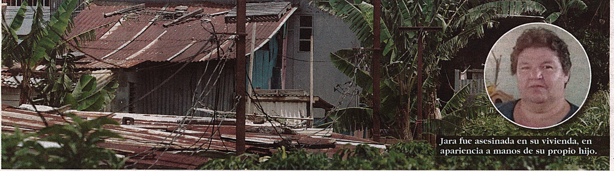
Jara fue asesinada en su vivienda, en apariencia a manos de su propio hijo.