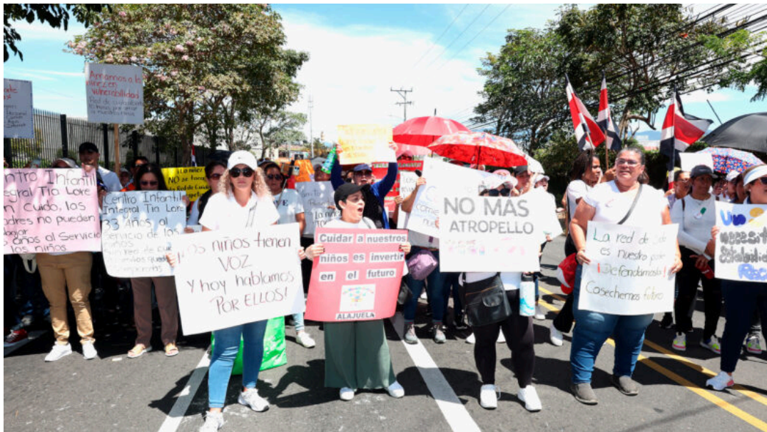
Padres de familia denuncian que el pago del servicio no está garantizado de manera continua.