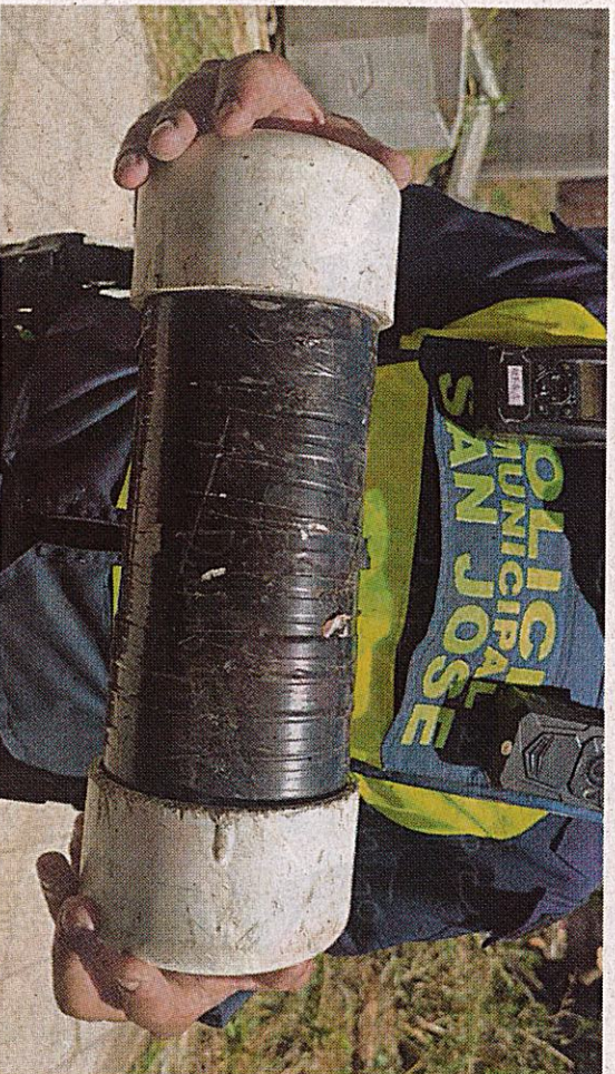
Las autoridades encontraron palos, muebles viejos y otra serie de objetos, con la finalidad de evitar las acciones policiales.

El director de este cuerpo policial, Marcelo Solano, indicó a través de redes sociales que el salón comunal es utilizado para el tráfico de drogas y, al momento de