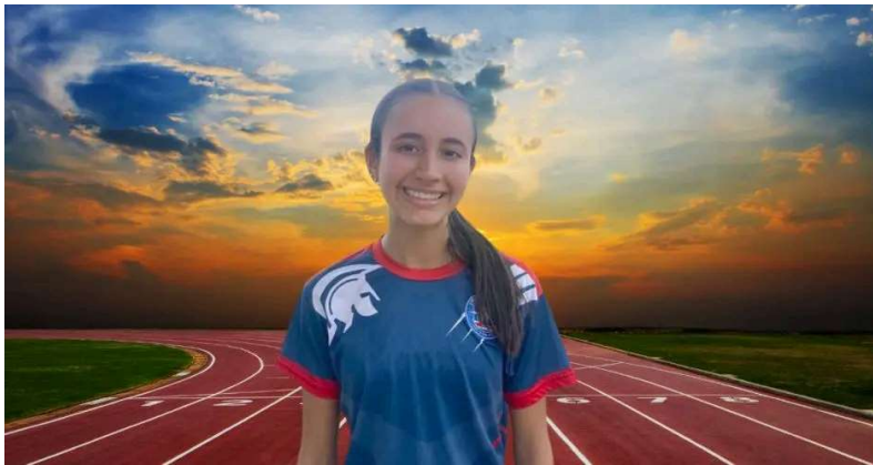
La joven señaló que fue a la competencia con la mentalidad de romper el récord. Más que correr