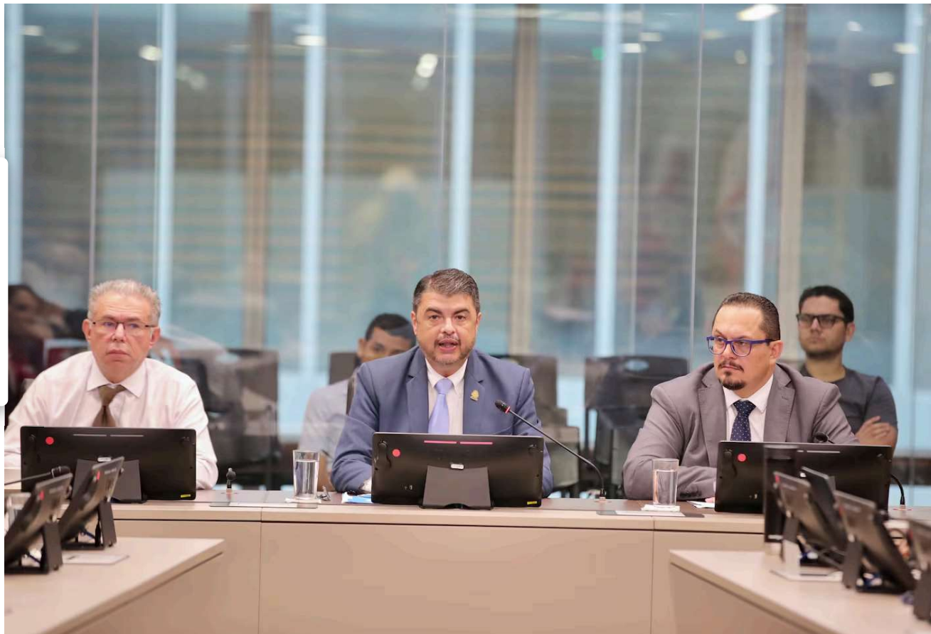
Mario Zamora, ministro de seguridad, fue duramente criticado durante el discurso de la diputada Obando.

Por si fuera poco, le mandó un duro mensaje al ministro de Seguridad, Mario Zamora, donde llegó a cuestionarlo por lo sucedido.