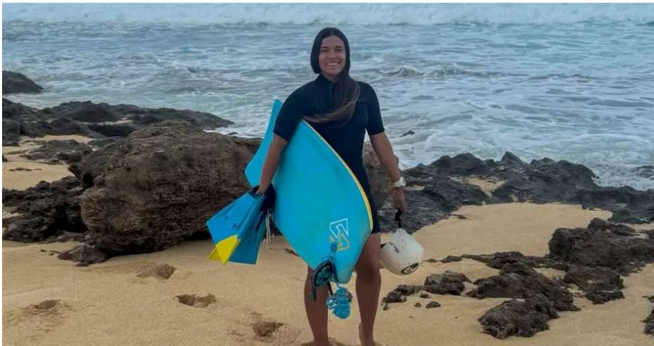
Comité Olímpico Nacional/La República