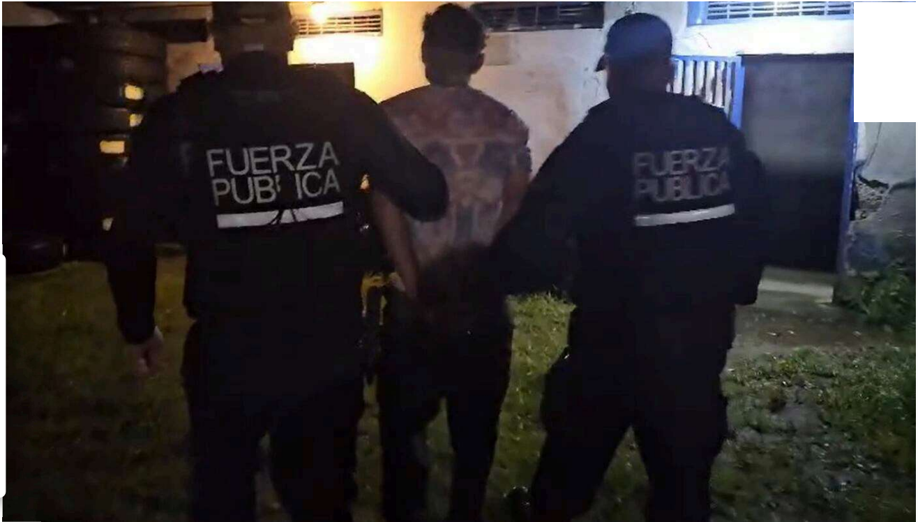
Detienen a sujeto que habría tratado de asesinar a expareja.