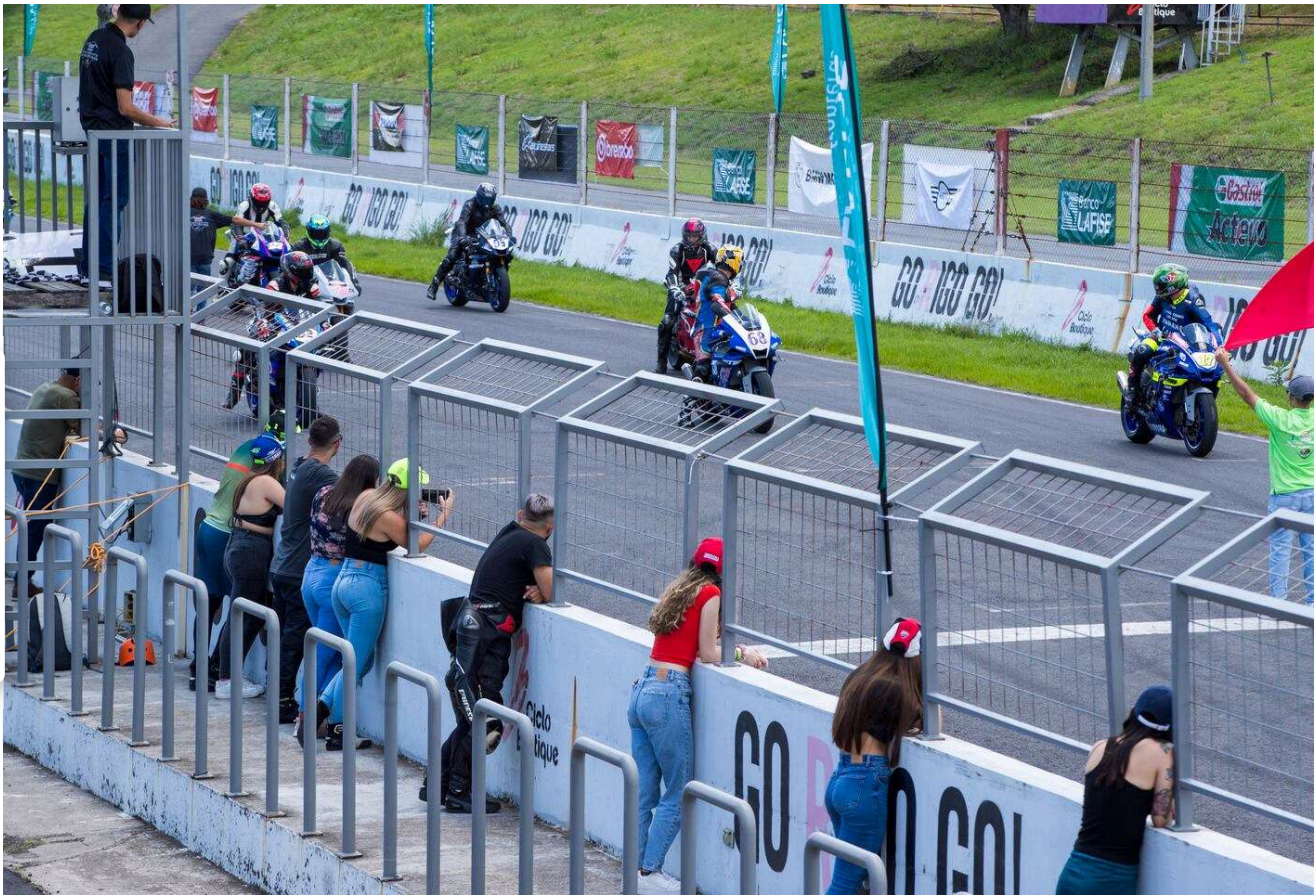
Algunos aficionados se ubicaron frente al sector de los 'pits' para vivir de cerca las carreras y tomar videos y fotografías de sus pilotos favoritos. (Jose Cordero)