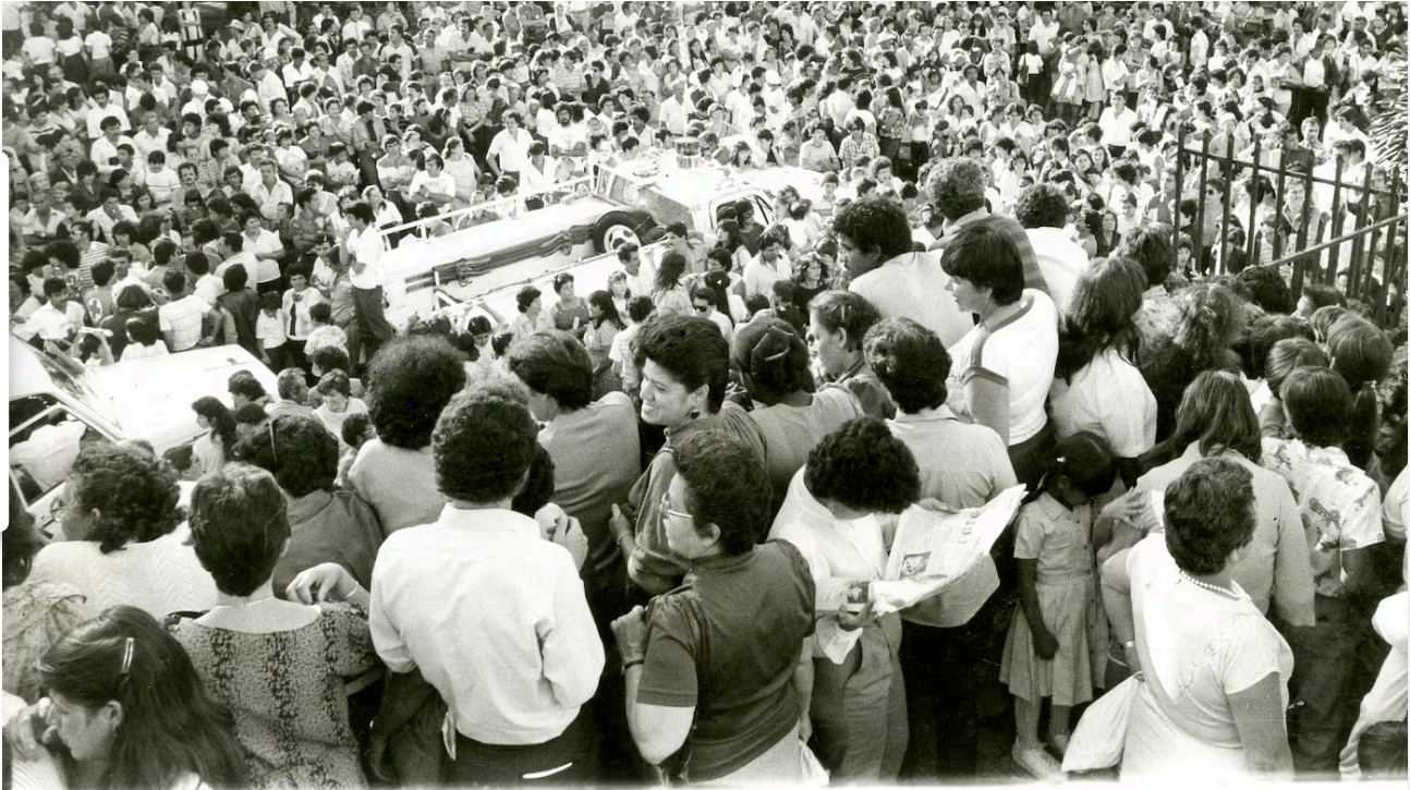
El crimen en la cruz de Alajuelita ocurrió en 1986 y causó conmoción al país.