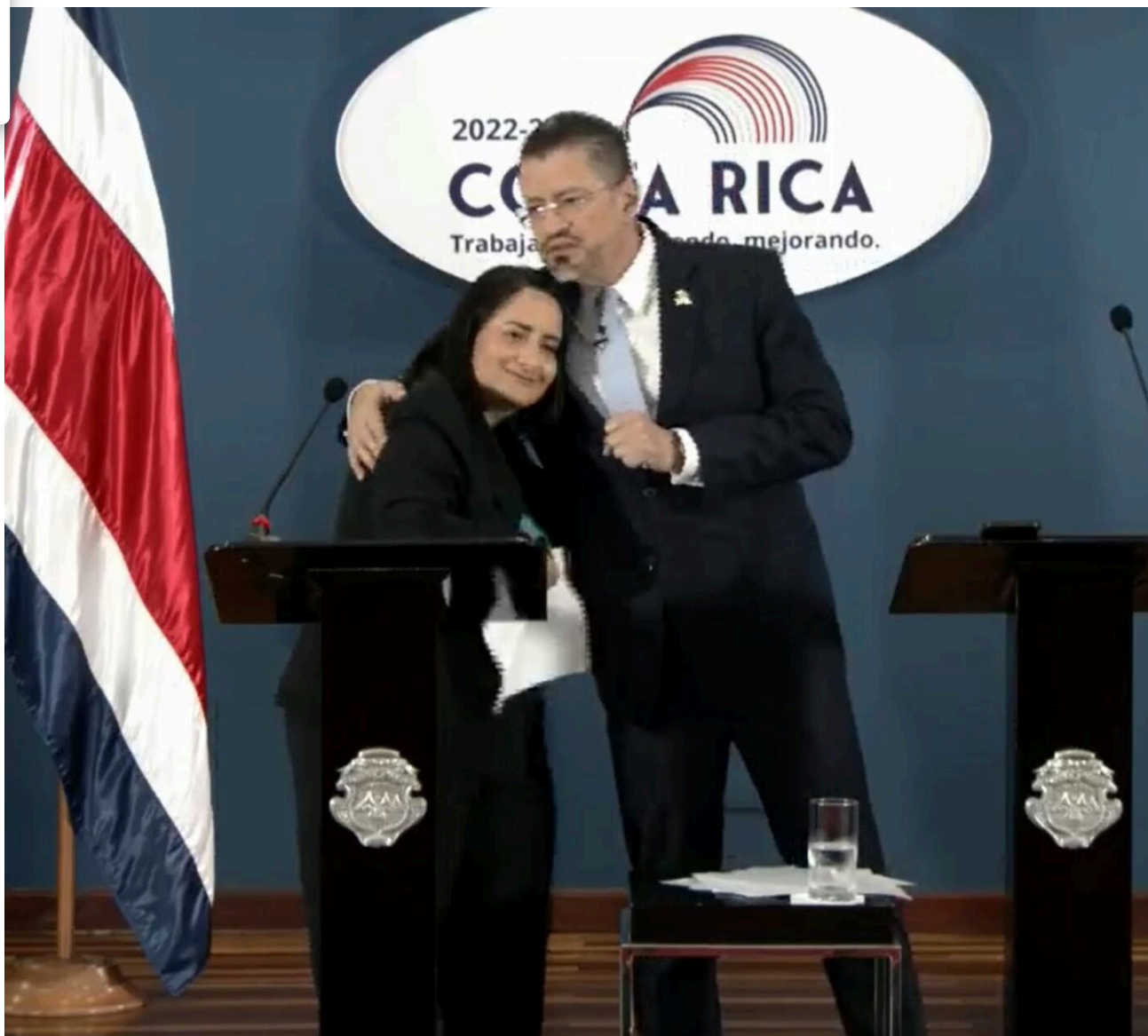
El presidente habría obligado a Gloriana a renunciar. Foto: Casa Presidencial. (Captura de pantalla)

Ella fue a comparecer este jueves a la Asamblea Legislativa y soltó la sopa sobre la pesadilla que asegura haber vivido al finalizar su gestión.