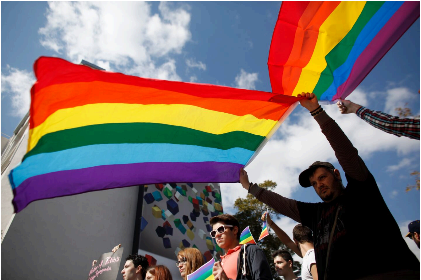
Activistas homosexuales sostienen banderas del arcoíris mientras protestan contra las leyes restrictivas de Rusia, esto en los escalones del museo de la Acrópolis en Atenas, el sábado 5 de octubre de 2013.

Moscú. Este 14 de julio, los diputados rusos aprobaron una ley que prohíbe las transiciones de género y, en particular, la adopción de niños por personas transgénero, en pleno giro ultraconservador desde la ofensiva en Ucrania.