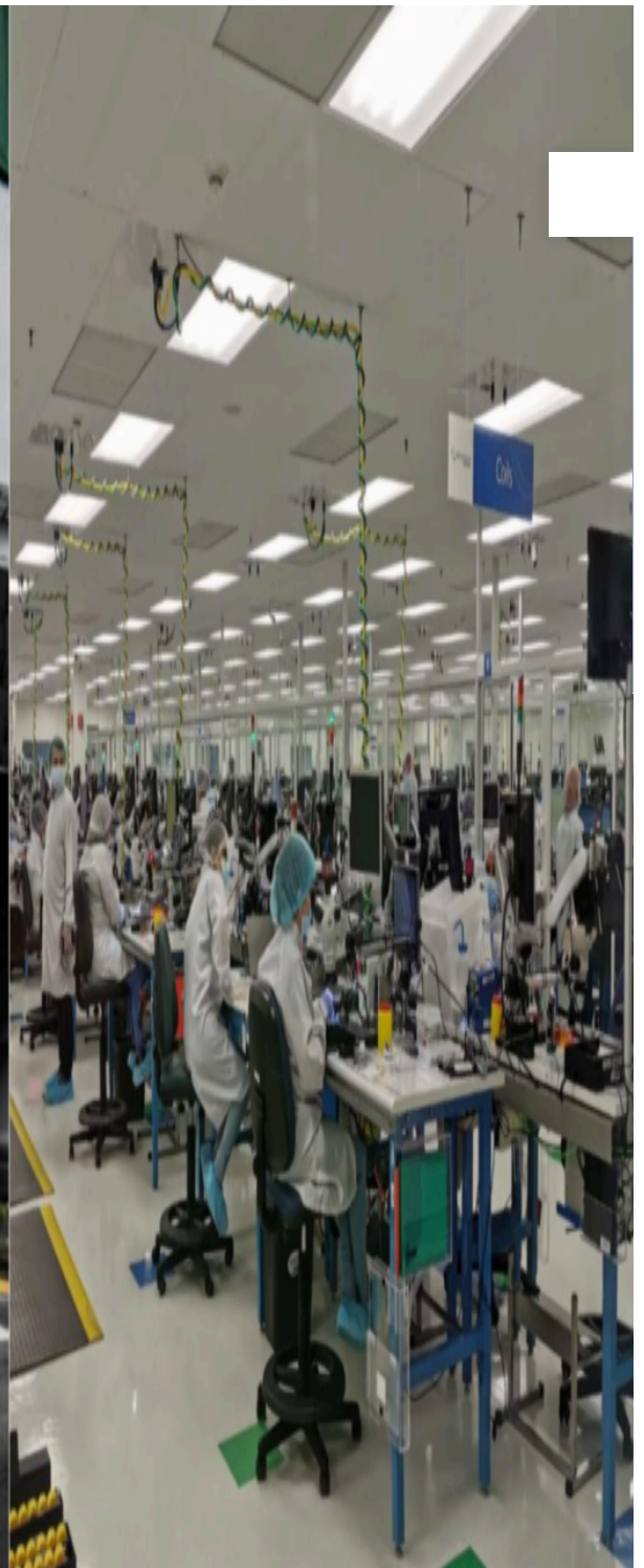
La industria de manufactura médica es una de los sectores que serían contemplados en la ley que establece las jornadas de 12 horas. Otras áreas son manufactura y servicios corporativos.