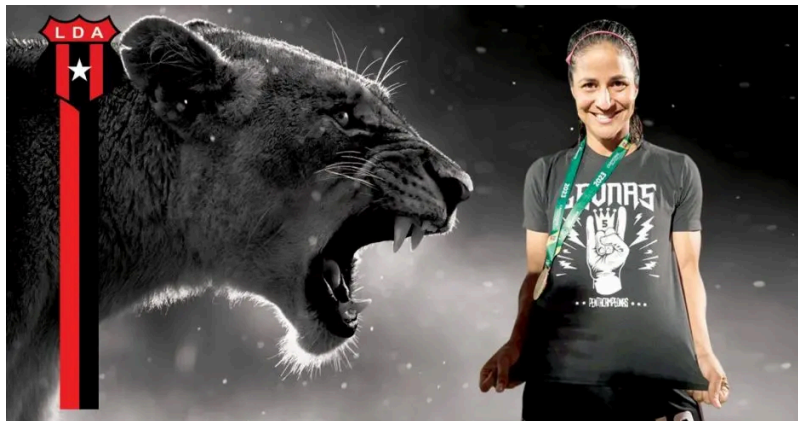
Shirley Cruz, leyenda, alzó la Quinta Copa Shirley Cruz, leyenda, alzó la Quinta Copa