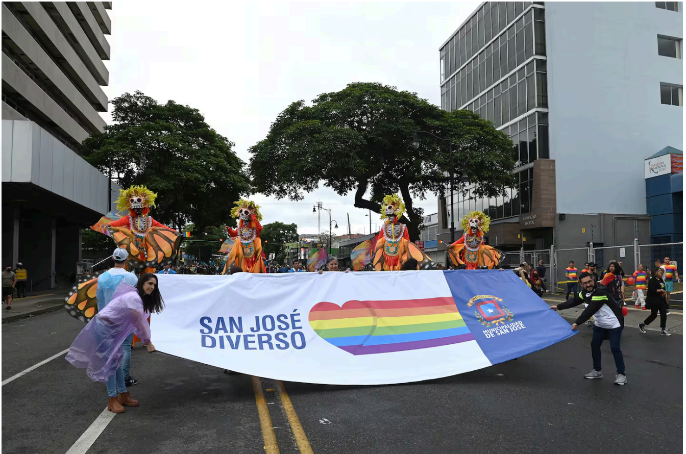
Música, proclamas y un gran desfile es parte de la celebración principal del mes del orgullo. (Albert Marín)

El evento bandera del mes fue anunciado desde marzo por la organización Pride Costa Rica. La tradicional marcha siempre se despliega en el corazón de San José. La fecha pactada para el evento es el domingo 25 de junio.