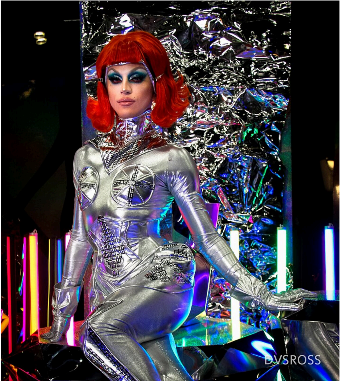
Aquaria se dio a conocer en el 2018 por su destacada participación en el concurso RuPaul's Drag Race.