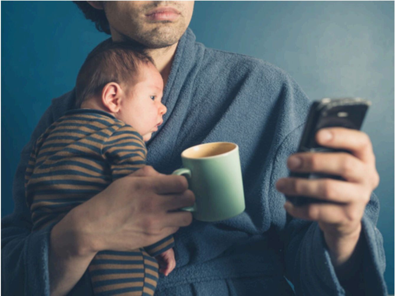
La licencia de paternidad puede motivar a las parejas jóvenes a incluir en su proyecto de vida el tener hijos.