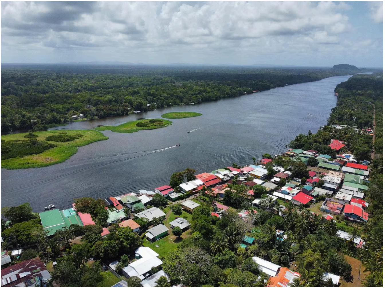
El OIJ analiza el crimen como un ajuste de cuentas.

El Diablo, quien había sido detenido en el 2015 por homicidio y luego liberado por orden de un juez, se ha convertido en uno de los líderes narco más buscados del país. En setiembre del 2020 alcanzó notoriedad a nivel nacional, pues presuntamente difundió audios en los que amenazó con asesinar a agentes del OIJ y oficiales de la Fuerza Pública.