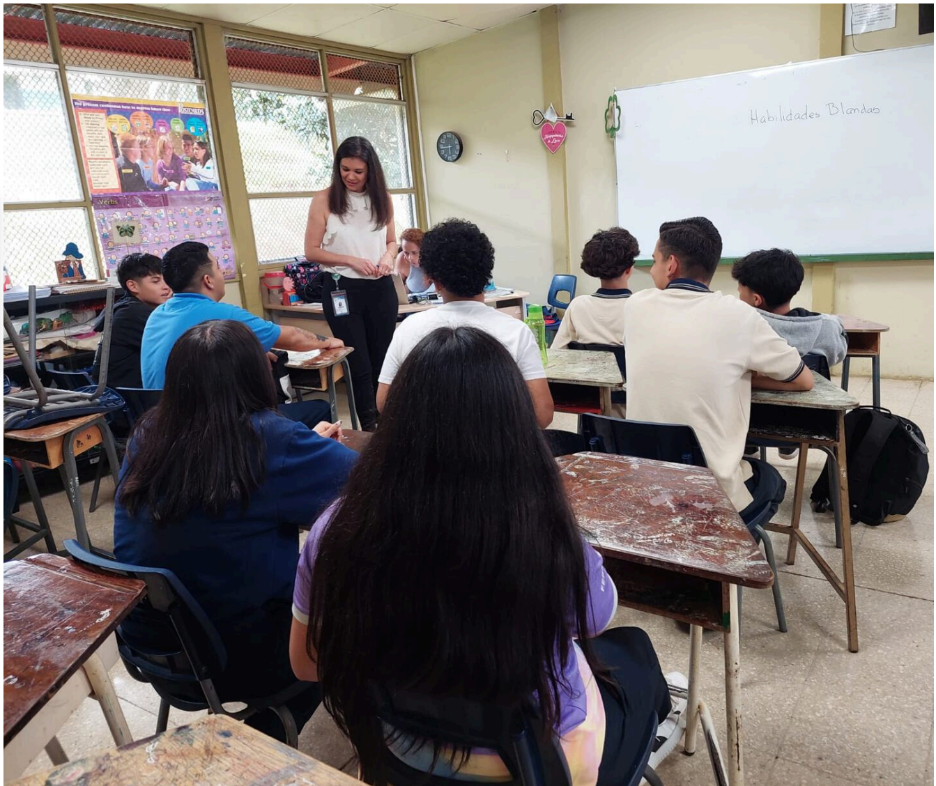
Coopesiba. Proyecto Red Conecta para prevenir suicidio, depresión y ansiedad en adolescentes. Junio 2023.

La profesional reconoció la sobrecarga de trabajo. En el caso de esta área de salud solo hay una psicóloga para Barva. “Hemos dado ya una alerta de que no damos abasto porque sí, hay chicos que tienen que esperar meses para ser atendidos.