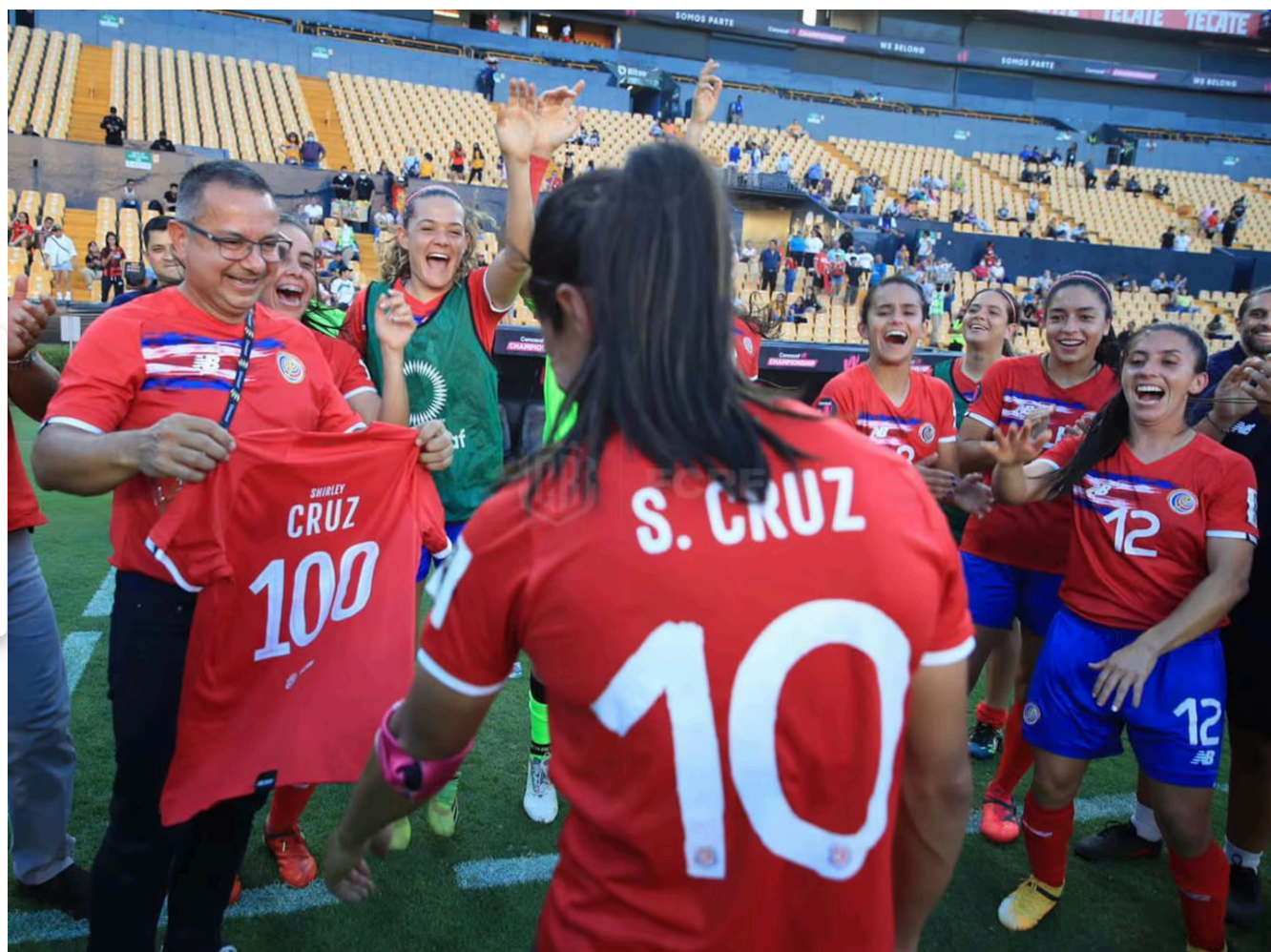
Hace un año la Fedefútbol homenajeó a Shirley Cruz por sus cien juegos con Costa Rica y ahora la hizo a un lado.

La ausencia de Shirley Cruz en la convocatoria de cara a la preparación para el mundial femenino de Australia y Nueva Zelanda es algo que golpeó fuerte el ambiente futbolístico por todo lo que significa la capitana.