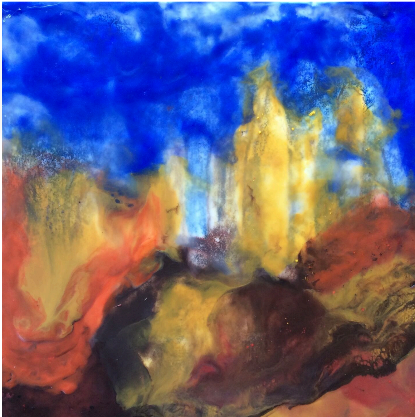
Obra de encáustica sobre madera titulada 'Los Crestones del Chirripó', de la artista nacional Ligia Kopper. Foto: Museo Calderón Guardia para LN. (Ligia Kopper)

La exposición Tierra de fuego , el testimonio de aquella niña impresionada con el Poás, de la artista que trabaja en su taller mientras haya luz y de la arquitecta perfeccionista, está abierta durante mayo y hasta el 3 de junio.