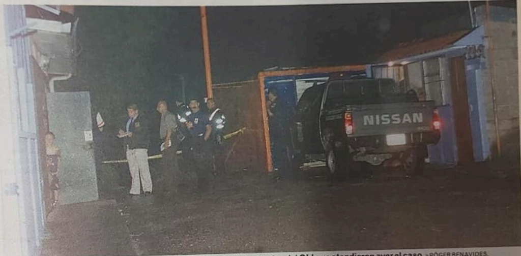
El lugar del crimen fue de difícil acceso para los cruzrojistas y agentes del OIJ que atendieron ayer el caso. »RÓGER BENAVIDES.

Conocidos de la pareja comentaron ayer que no les extrañó el desenlace, ya que entre ambos había muchos problemas por celos.