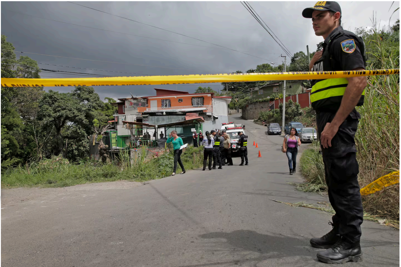
El homicidio ocurrió en Los Guido de Desamparados.