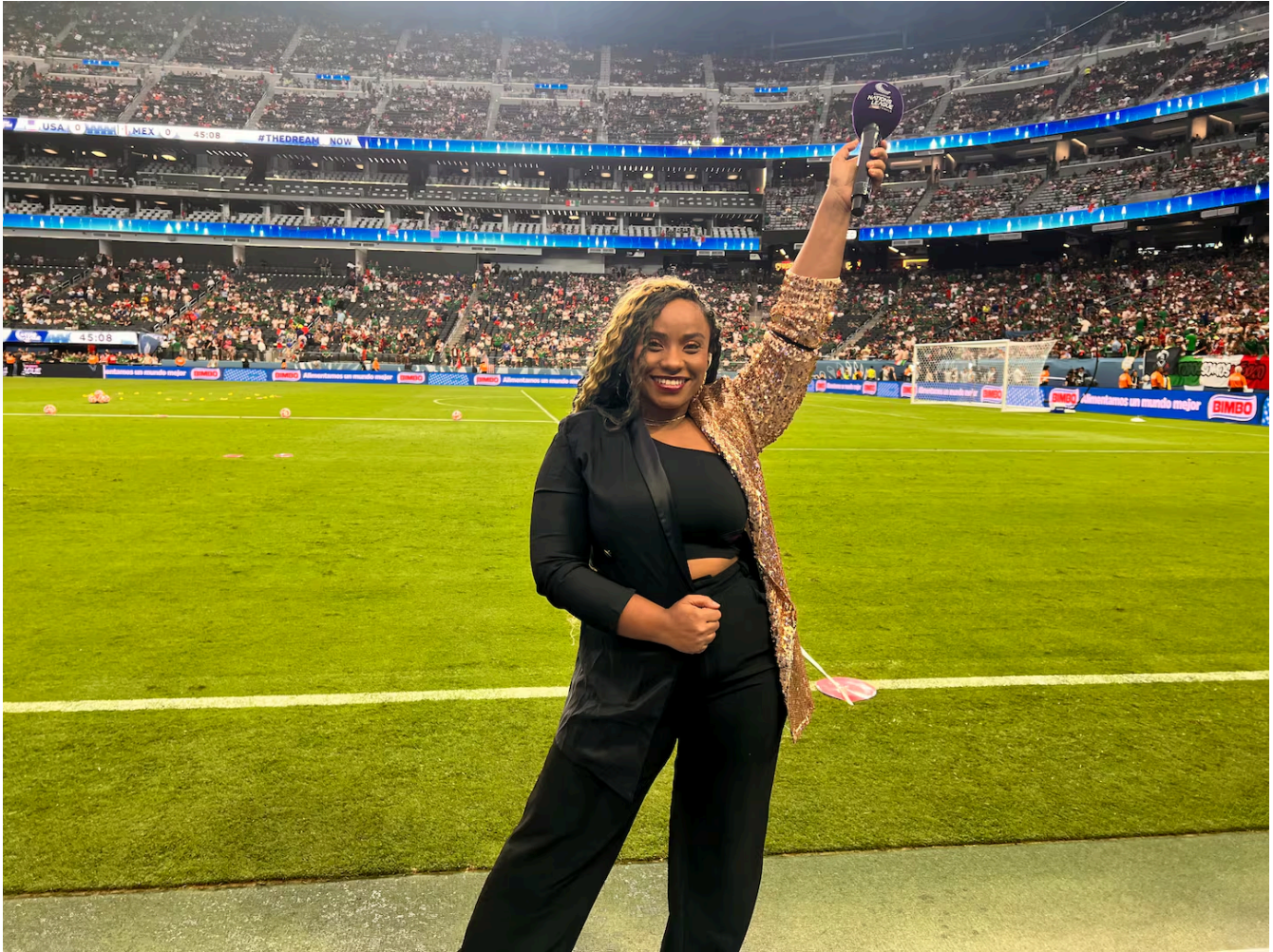
Rose Davis lista para presentar la final de la Liga de Naciones de Concacaf en el Allegiant Stadium, en Las Vegas.

de FIFA y Concacaf en sus diferentes partidos, y presentar, por ejemplo, en la inauguración de la Copa Oro, en Estados Unidos.