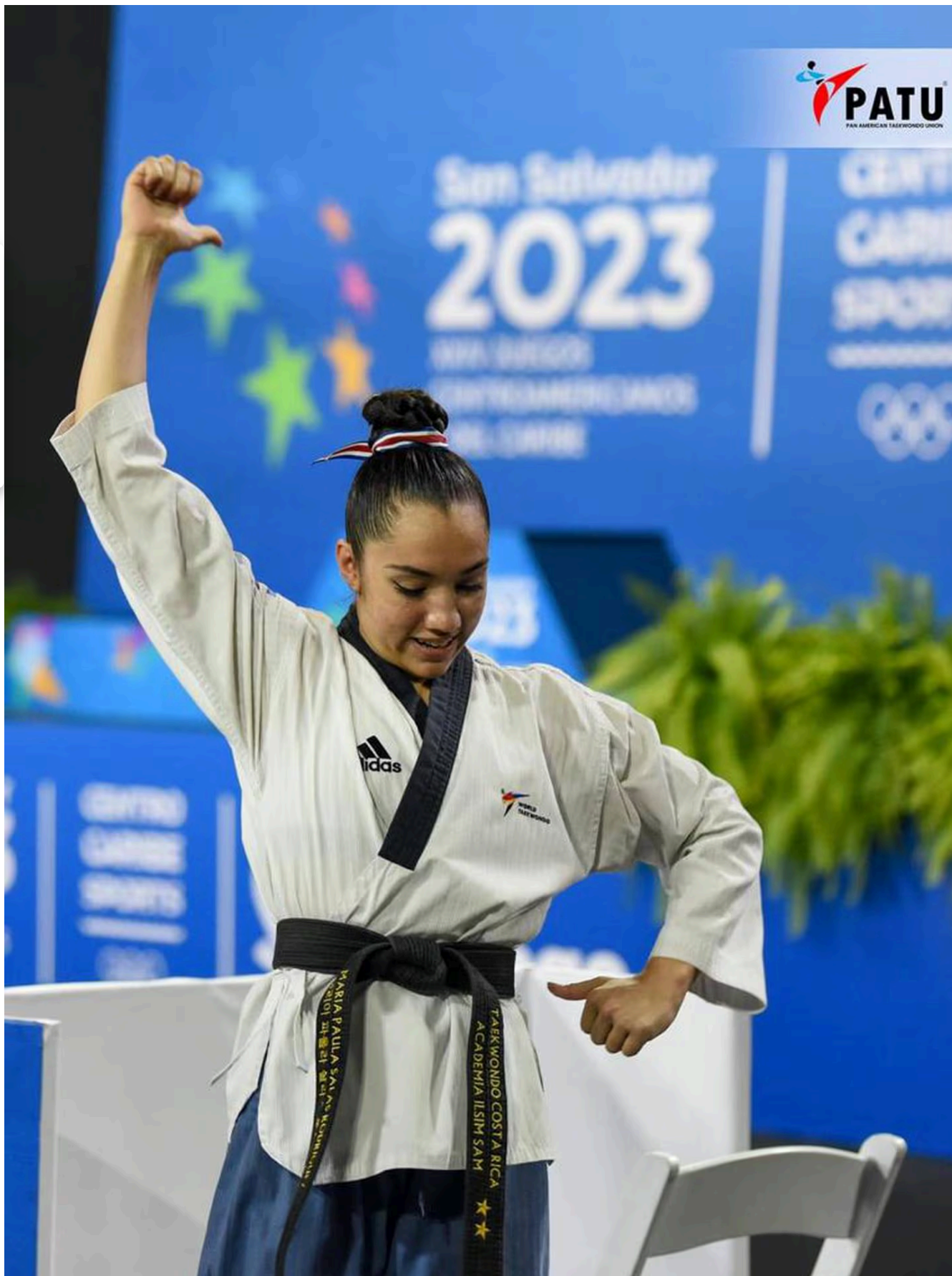
Ella fue la primera medalla de oro tica en los Centroamericanos y del Caribe San Salvador 2023.