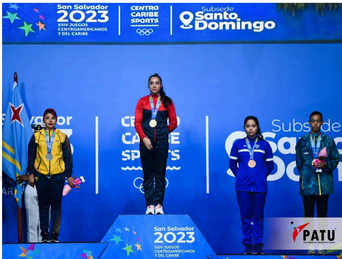
Costa Rica en lo más alto del podio con una vecina de San Isidro de Heredia.