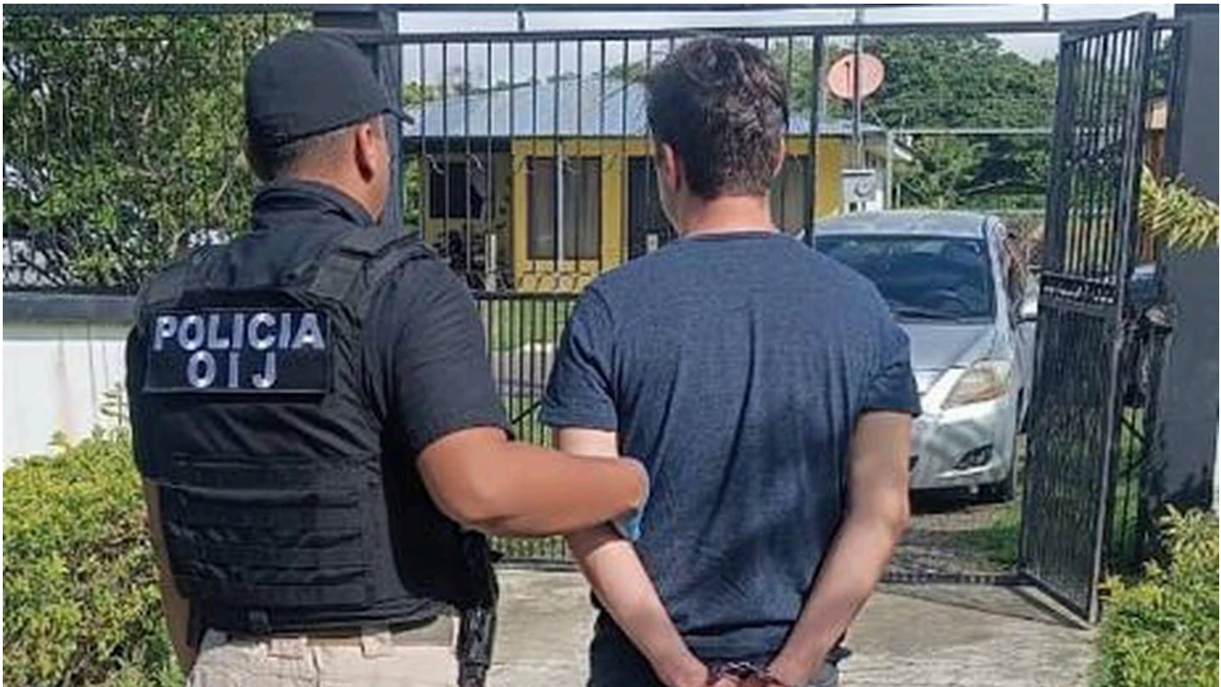
Un doctor de apellidos Mena Díaz, de 31 años, habría aprovechado su investidura para grabar a menores de edad desnudas mientras les daba consulta.