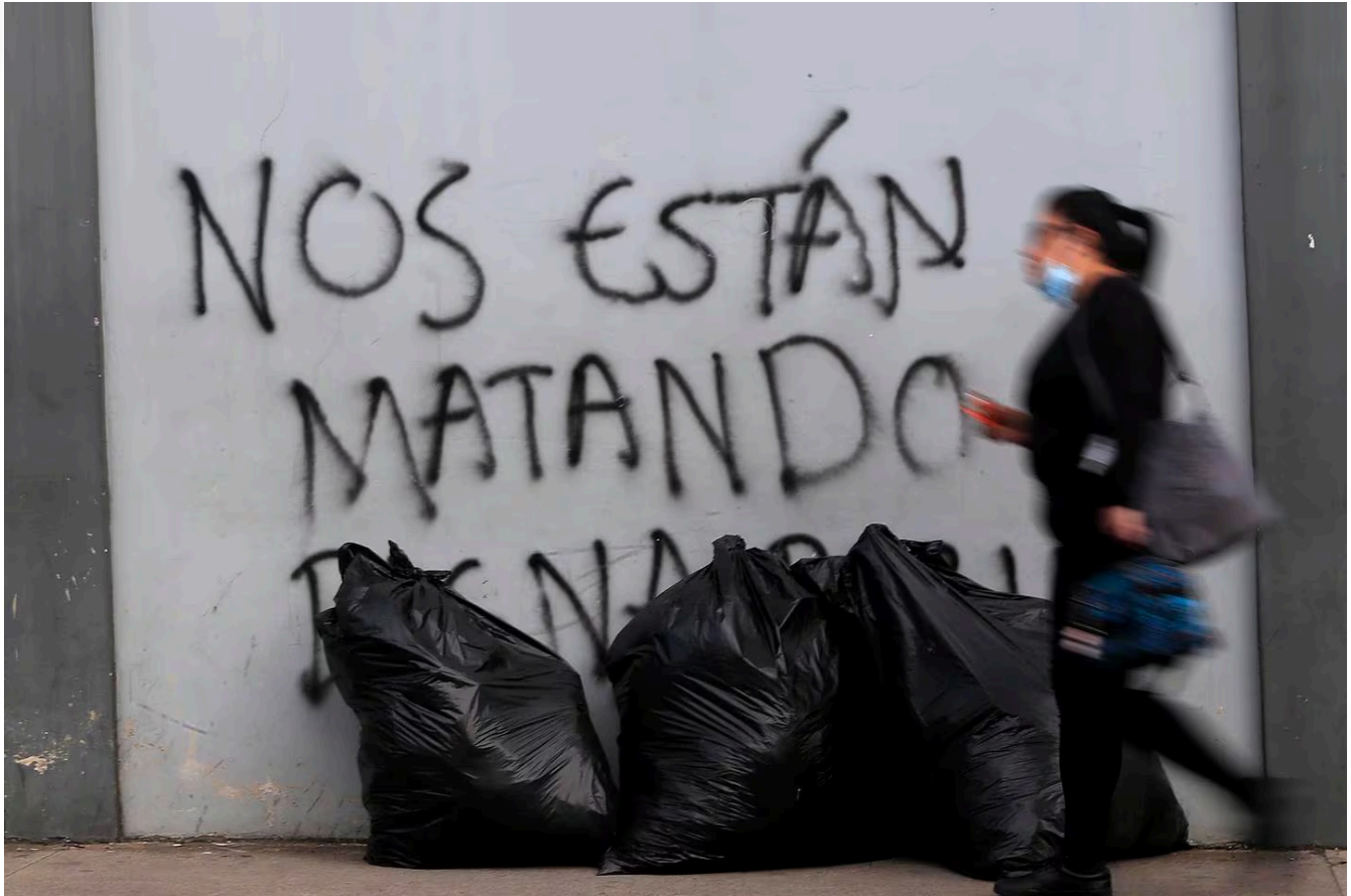
El sujeto hostigó a la víctima varias veces después de que ella no quiso ser su novia. Imagen con fines ilustrativos.

La sentencia fue dictada el 12 de junio en el Tribunal Penal de Limón. El sujeto pasará en prisión preventiva mientras el fallo adquiere firmeza.