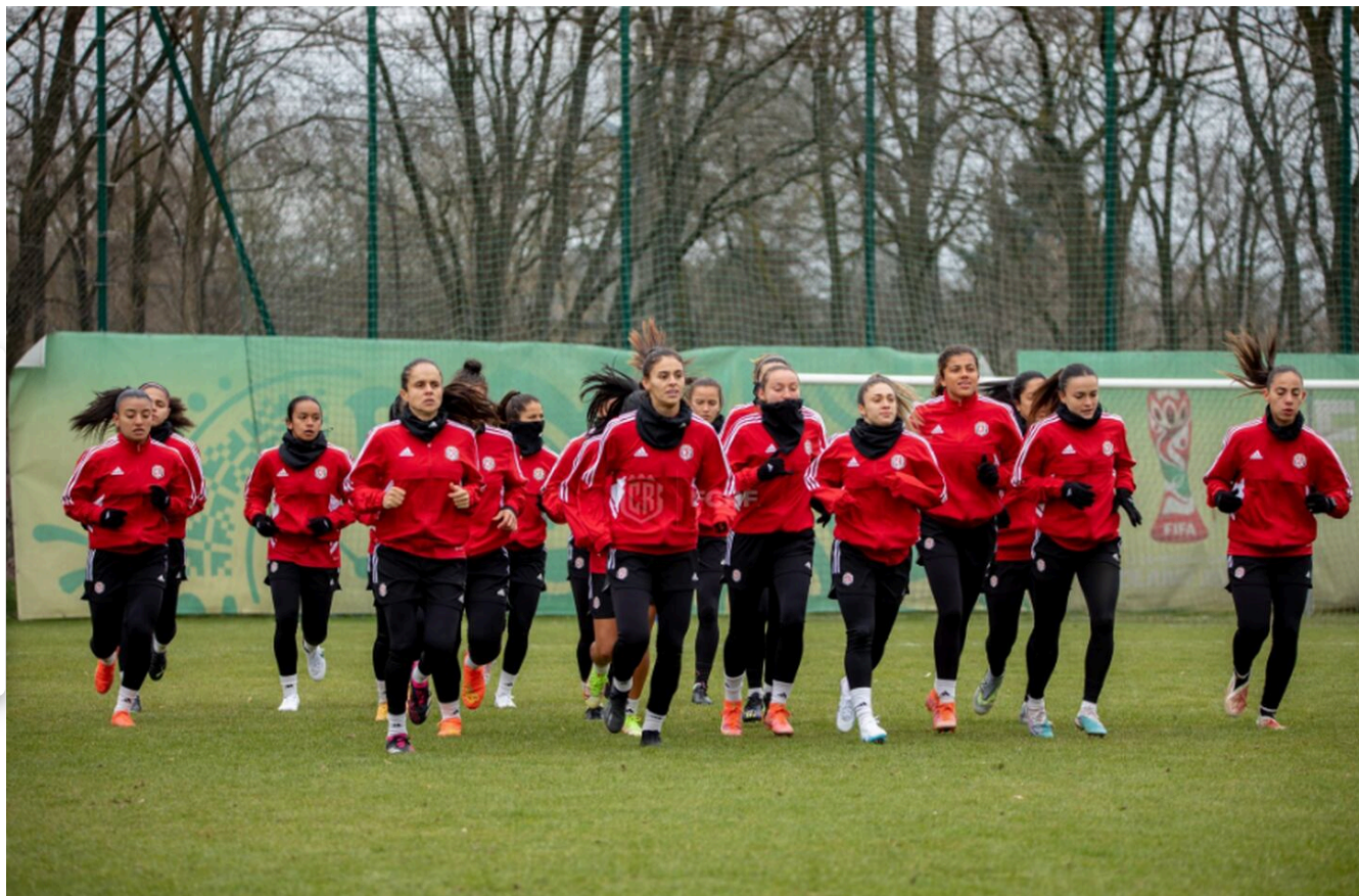
La participación de las ticas será clave para conocer cuánto dinero recibirá la federación.

Las últimas semanas de la Selección Femenina previo al Mundial Australia - Nueva Zelanda han sido muy agitadas, desde la escogencia de quiénes estarían en el campamento de preparación y hasta la convocatoria final, pero todavía falta una pregunta por responder: ¿Cómo se repartirán los dineros que ganarán las ticas por competir en este certamen?