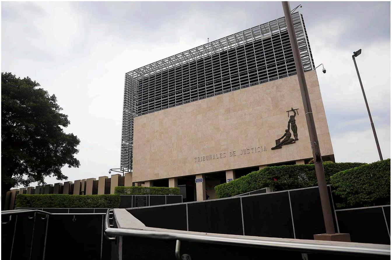
La sentencia fue dictada en los tribunales de Alajuela.

Por agredir a la mujer con la que tuvo una relación durante 20 años, un hombre de apellidos Guzmán Araya pasará ocho años preso.