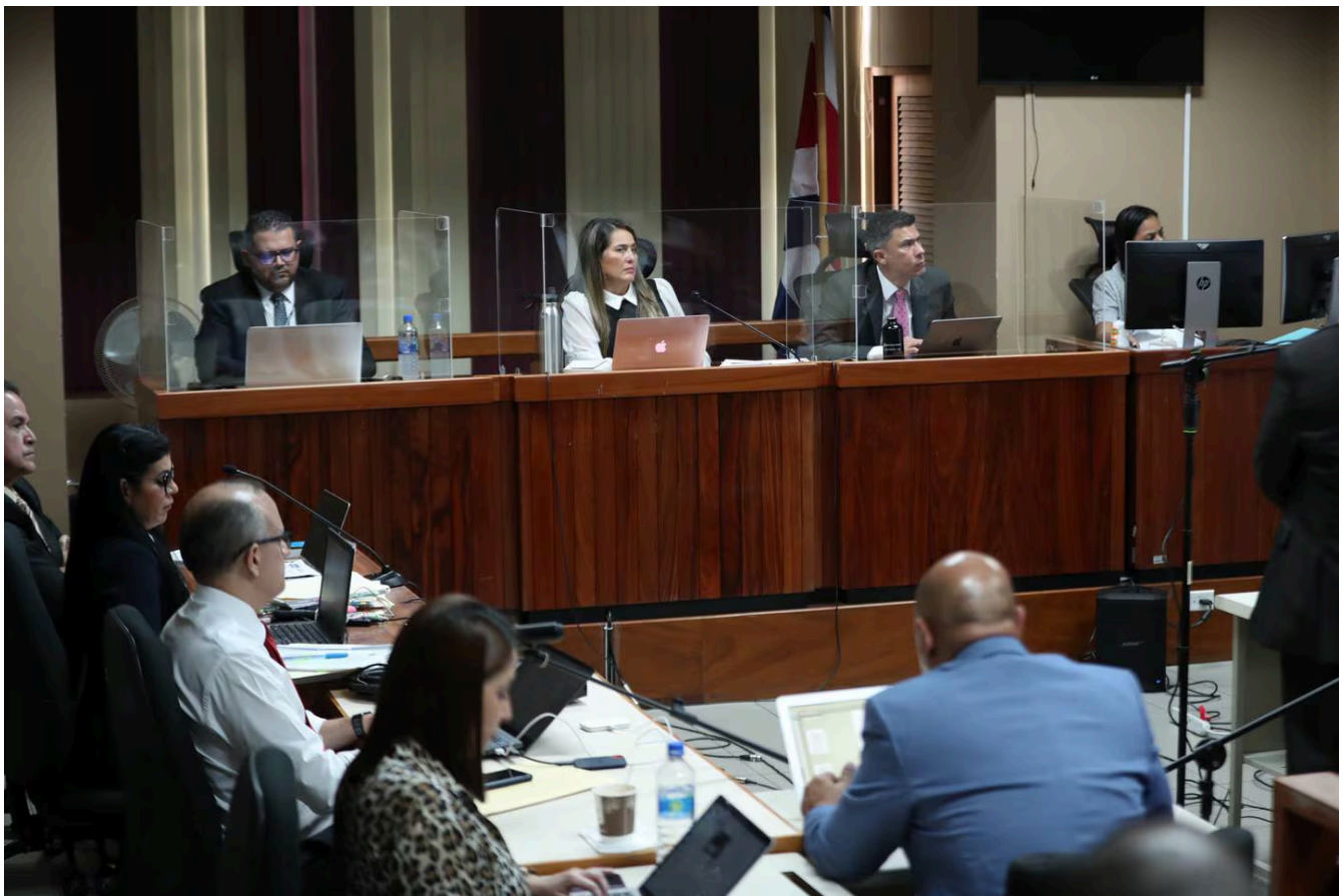
El juicio, iniciado en setiembre, podría terminar en las próximas semanas.

Uno de los cuestionamientos realizados por el Ministerio Público a la perita, es que ella no tuvo acceso al cuerpo de Cedeño para analizar las mordidas, como sí lo tuvo el odontólogo Fernández.