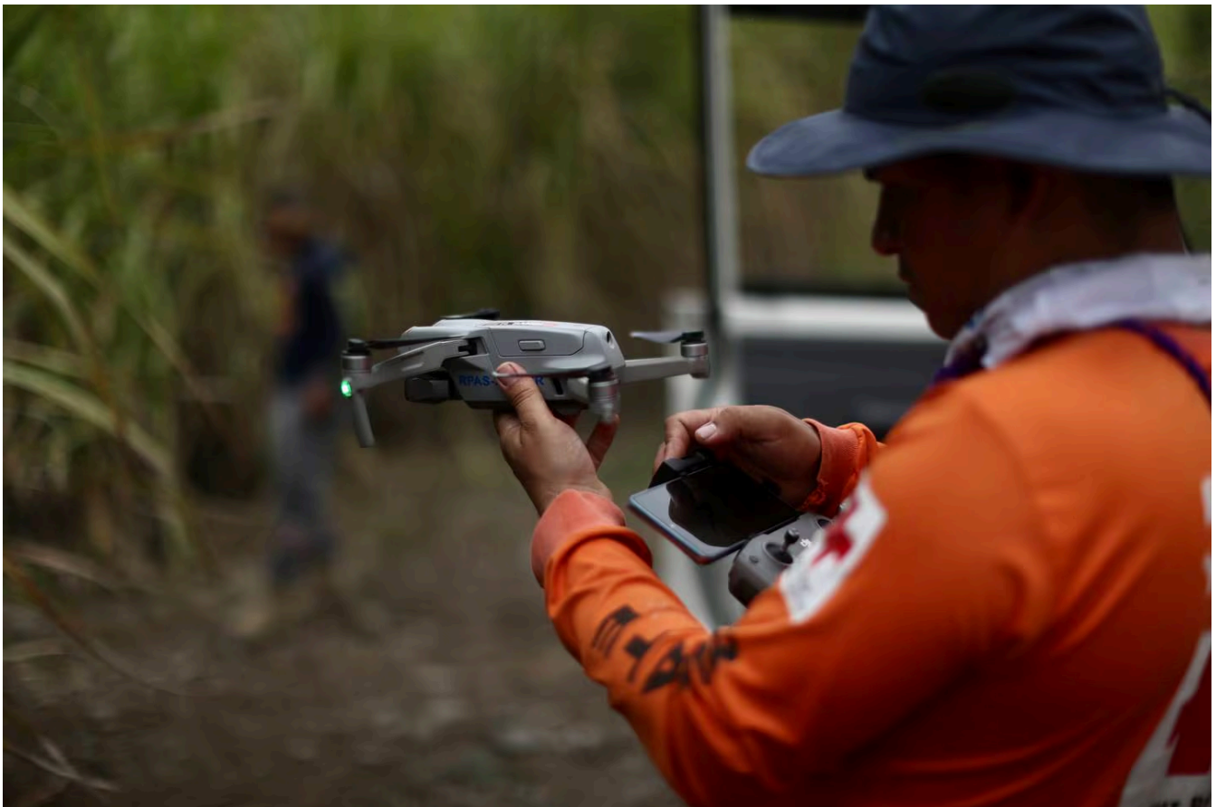
El OIJ usará drones con cámara térmica en la búsqueda de este martes. (Jose Cordero)

“La línea de investigación hasta este momento es que este sujeto actuó solo, él sabía que era el papá (de Keibril) y lo que buscó en ese momento fue evitar ser encontrado como padre de la criatura, que al final siempre lo logramos”, dijo Zúñiga.