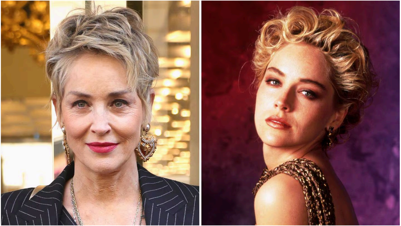
La actriz Sharon Stone reveló sus malas experiencias en el rodaje de 'Bajos instintos'.

Fue claramente el film que la catapultó al estrellato. Sin embargo, cada vez que Sharon Stone evoca su experiencia en Bajos instintos , la invaden muy malos recuerdos. En una reciente entrevista, la actriz reveló que fue humillada durante toda la filmación y contó que su coprotagonista, Michael Douglas, cobró muchísimo más que ella.