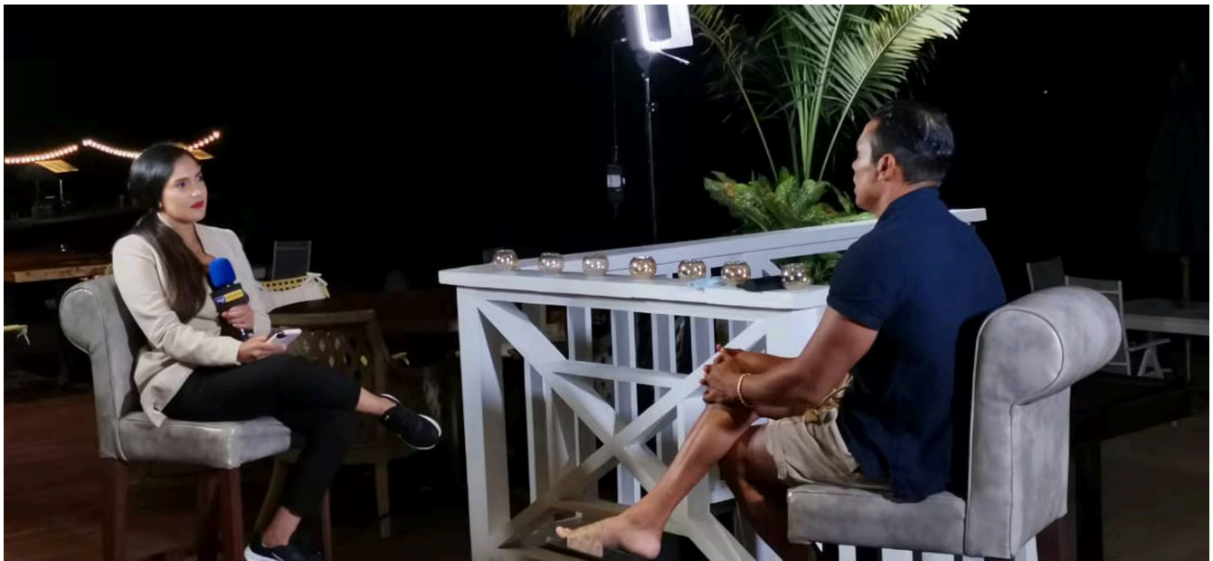
Irene Chinchilla entrevistando al ex futbolista Walter Centeno para Tigo Sports. (Irene Chinchilla)

“Me costó varias semanas convencer a Walter Centeno de realizar la entrevista y al final aceptó. Eso sí, había que viajar a la Zona Sur, (unas 6 horas). Pudimos conversar de sus diferentes facetas, incluso recordó su infancia, cuando jugaba descalzo y en “calzoncillos” o cuando trabajó en la fábrica de frutas en la que laboraban sus papás”.