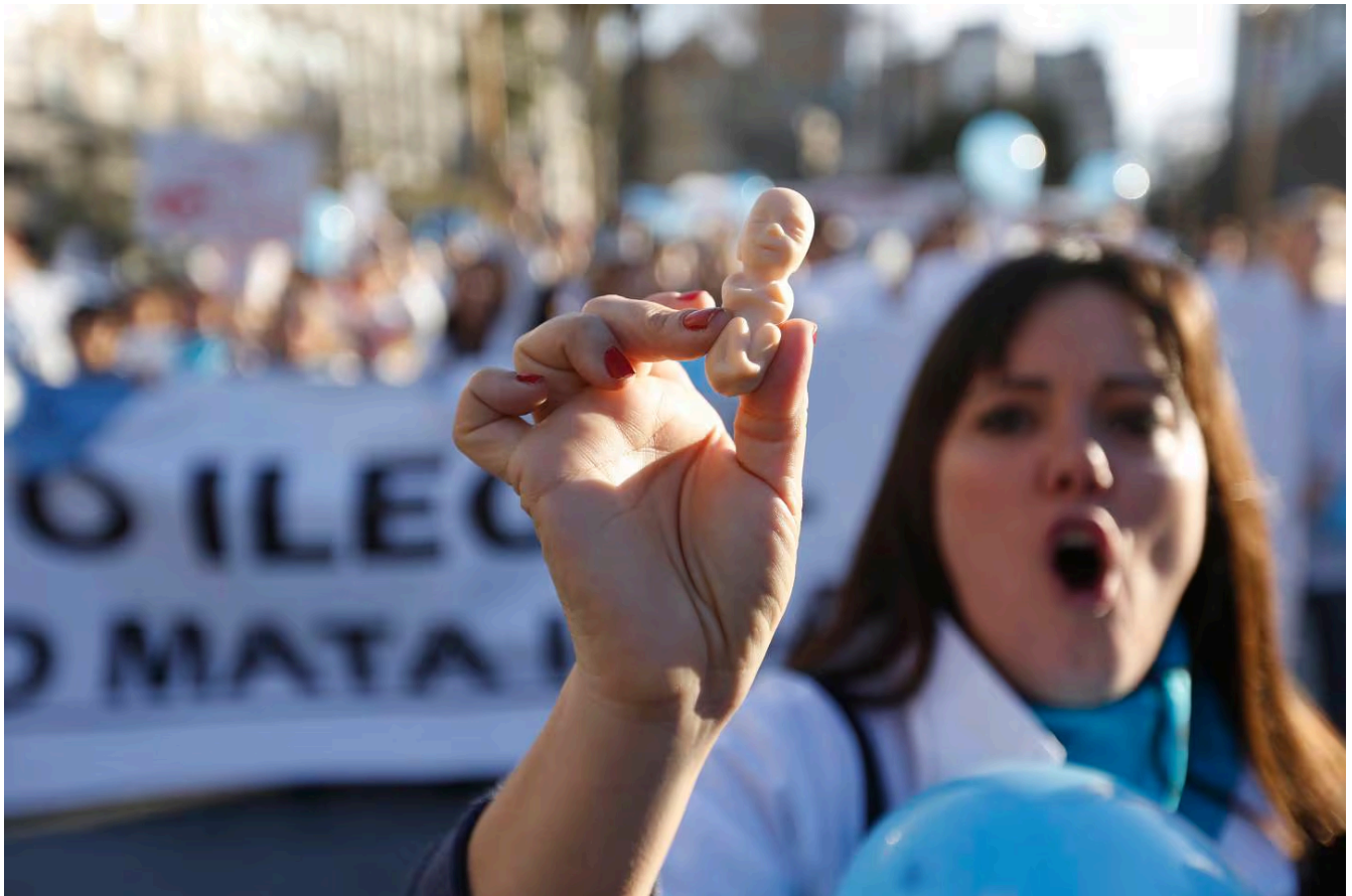
Manifestación anual es convocada por la plataforma "Sí a la vida".

En esos centros de salud se practican menos del 15% de los abortos del país, debido principalmente a la masiva objeción de conciencia de los médicos, lo que obliga a muchas mujeres a desplazarse cientos de kilómetros para abortar.