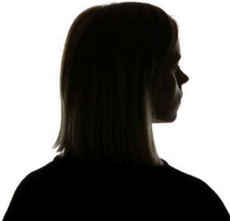
El cuerpo de la mujer sigue siendo violentado, usado, manipulado y odiado hasta por su propia sombra.