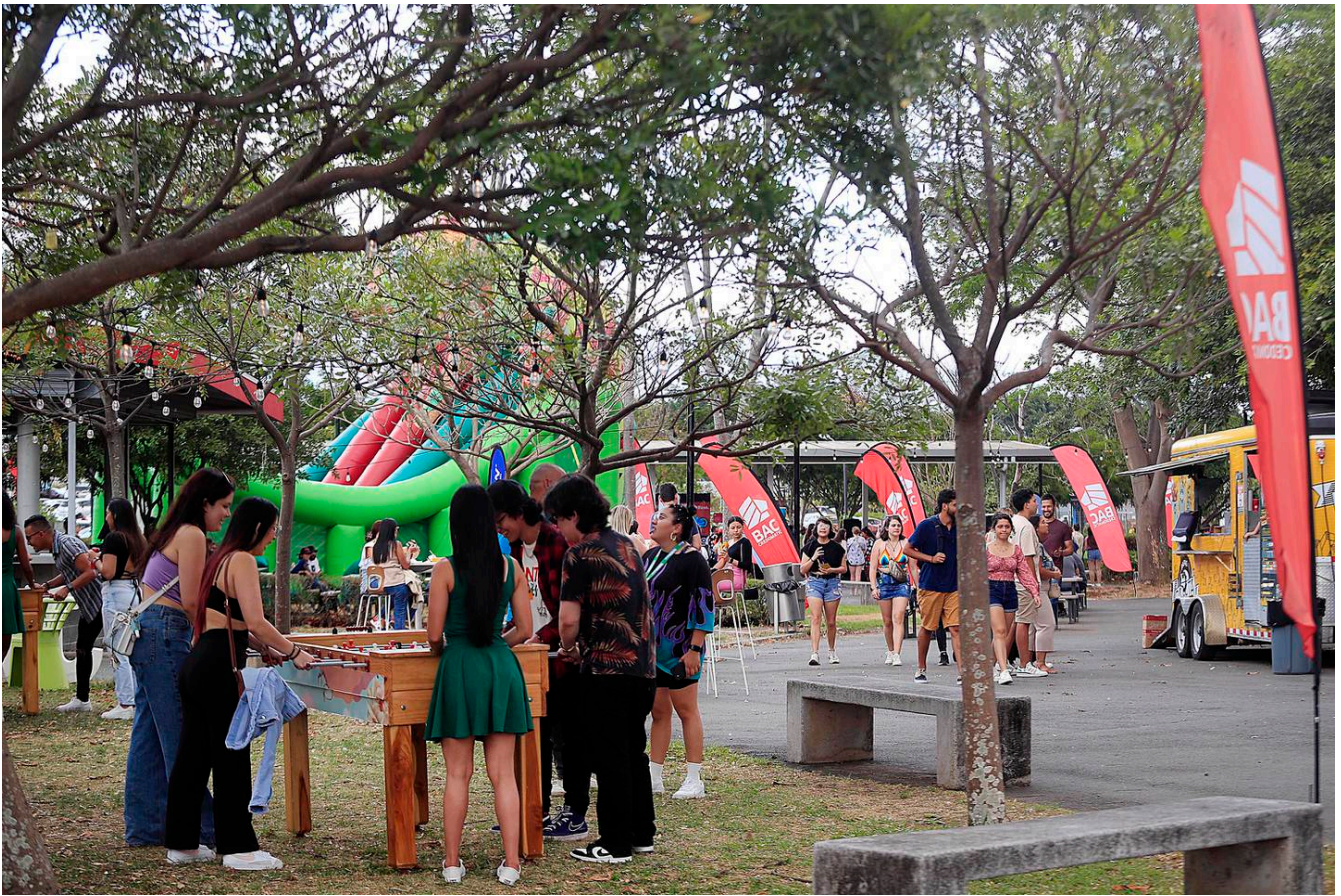
Los futbolines se convirtieron en uno de los juegos más concurridos. En el recinto no había quien se resistiera a una mejenga. (Rafael Pacheco Granados)