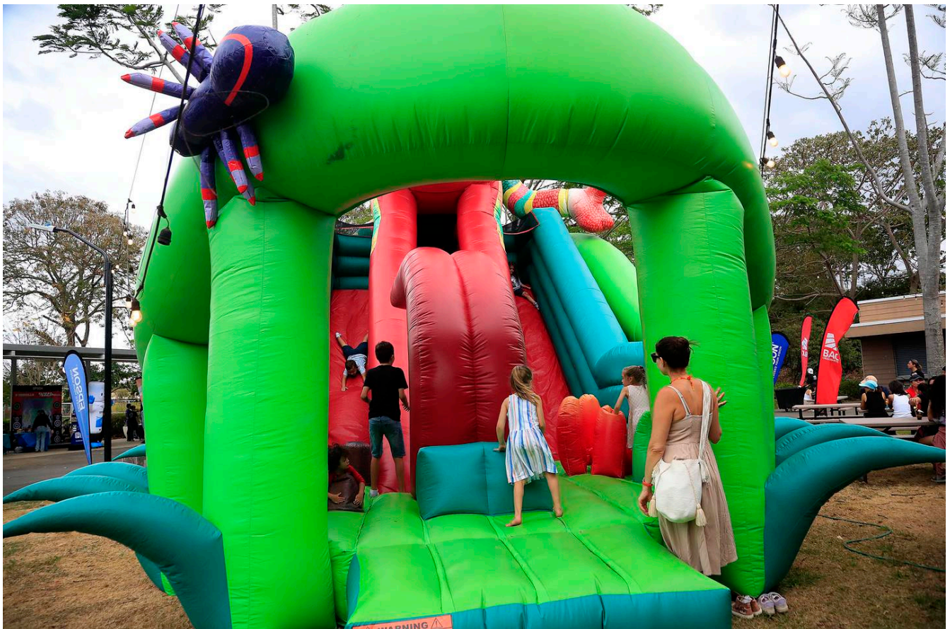
Mientras la música amenizaba el ambiente, en los coloridos inflables los niños brincaban y reían sin parar. (Rafael Pacheco Granados)