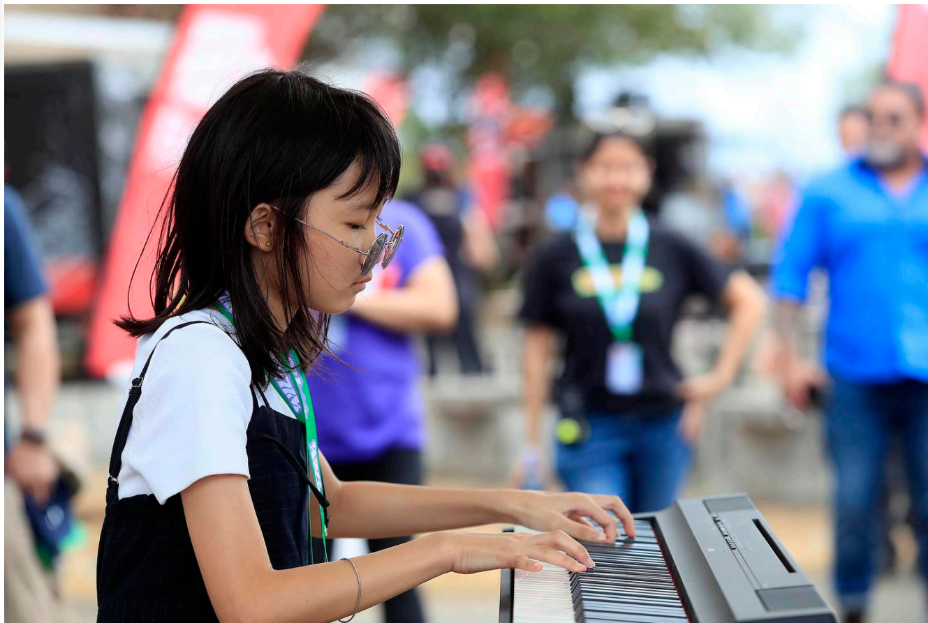
Los niños del Instituto Superior de las Artes deleitaron al público con su talento en el piano. (Rafael Pacheco Granados)

Estas son algunas imágenes que resumen la primera edición del Wila Fest.