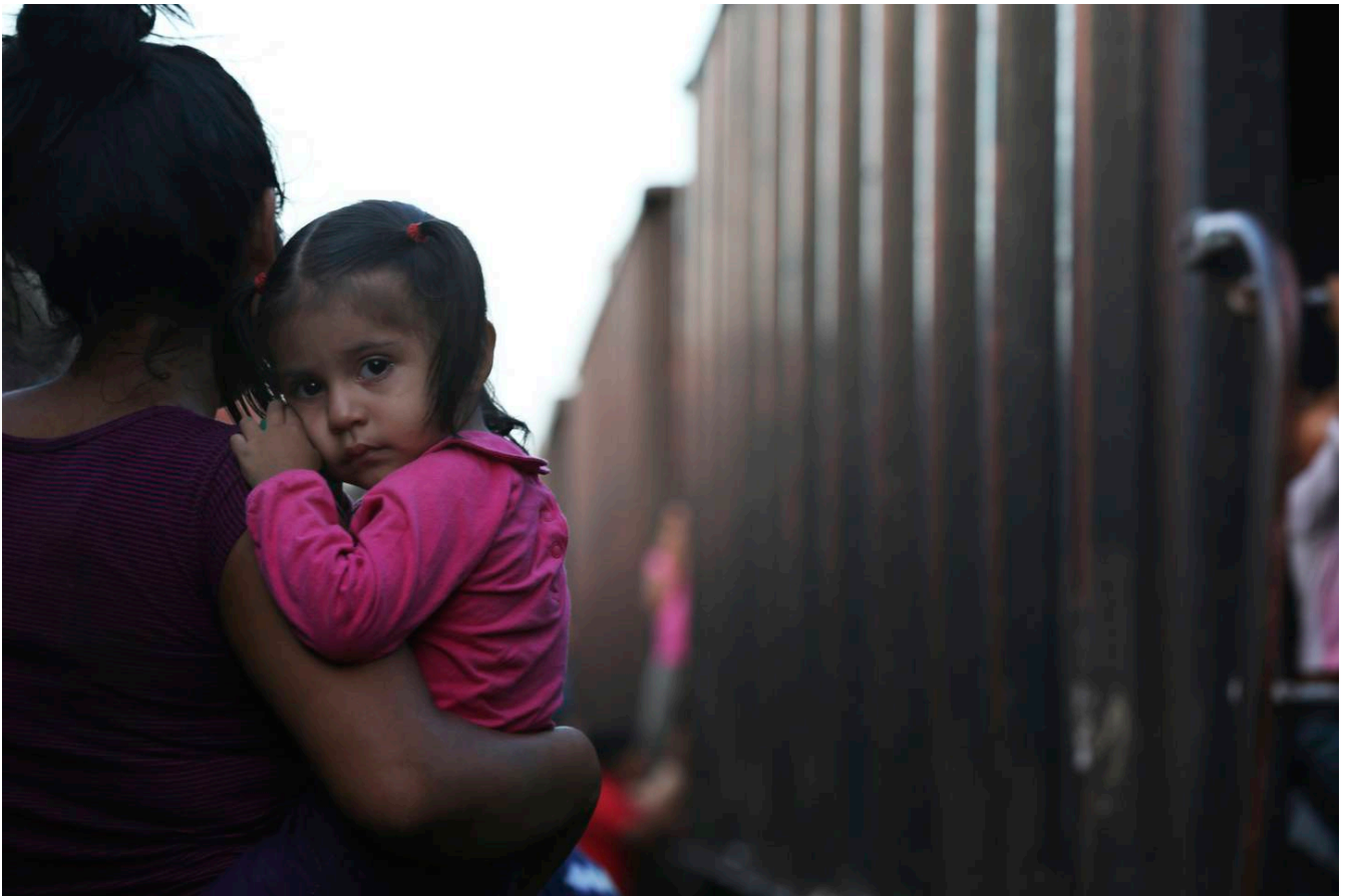
Una madre y su hija esperan un tren de carga, en el estado mexicano de Chiapas, para viajar en dirección hacia Estados Unidos.