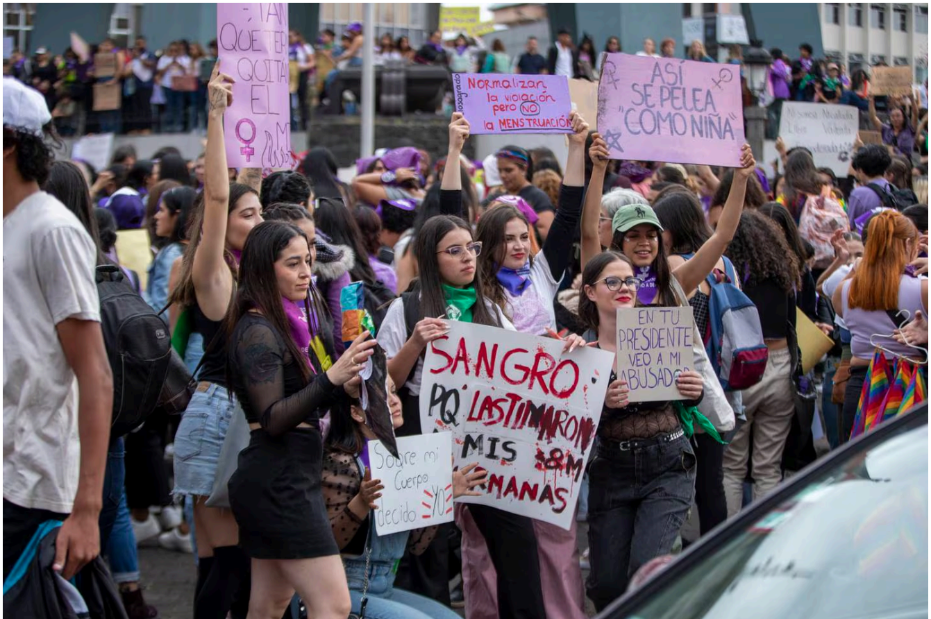
Marcha en Costa Rica el 8 de marzo, Día Internacional de las Mujeres.

La autora es activista cívica de 16 años.