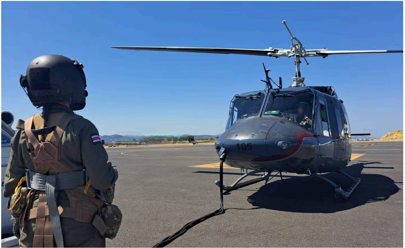
Este tipo de helicópteros UH-1H llegó a Costa Rica en el 1991 a bordo de un Globemaster C-17 de Estados Unidos.

“El Gobierno de Estados Unidos es un indudable aliado de Costa Rica, gracias a esto, el Servicio de Vigilancia Aérea (SVA) del Ministerio de Seguridad Pública cuenta con el Programa de Aviación, el cual es impartido por medio de la Oficina para Asuntos Antinarcóticos, Seguridad Ciudadana y Justicia de la Embajada de los Estados Unidos de América”, comentó Cynthia Telles, embajadora de los Estados Unidos en nuestro país.