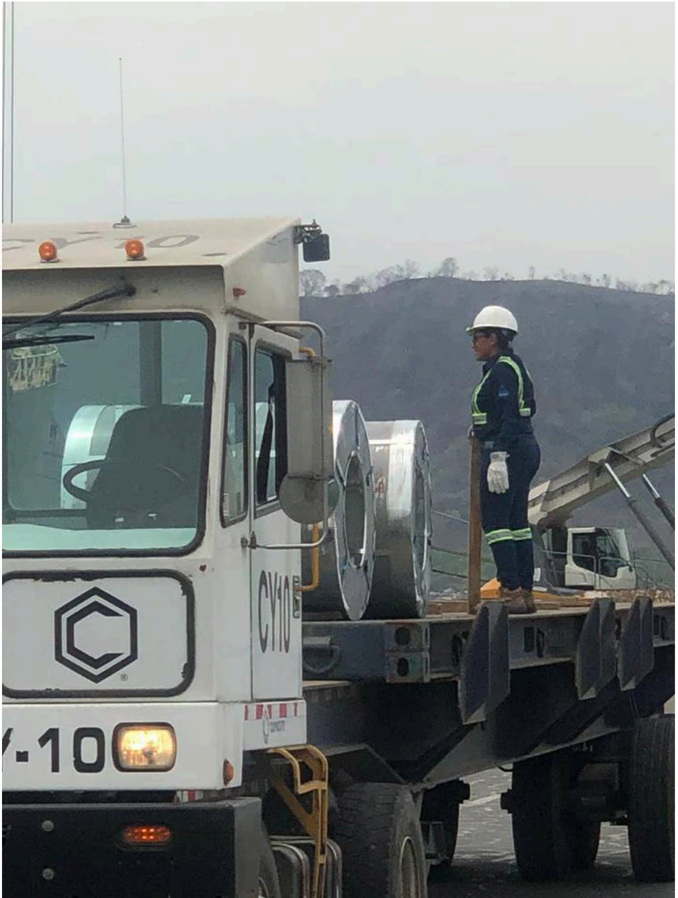
Una puntarenense de otro nivel.

La puntarenense asegura que le encanta su trabajo porque es una forma de mostrar que no solo los hombres pueden ejercer este tipo de labores y que siempre ha destacado por ser una mujer que le gusta aprender e todo.