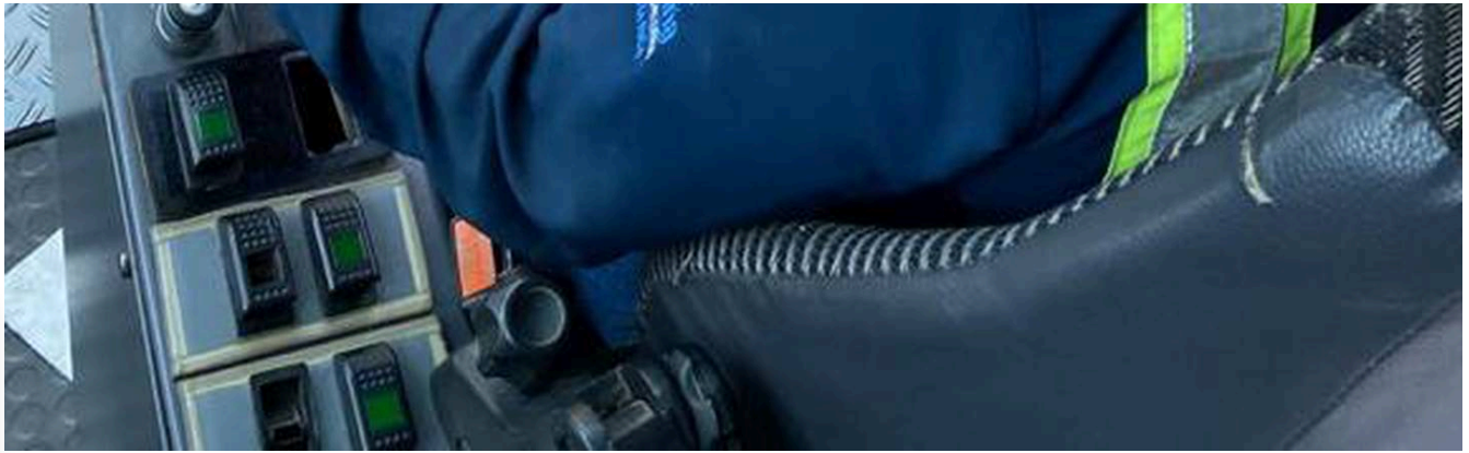
Todo se puede lograr en la vida asegura Yuendy.