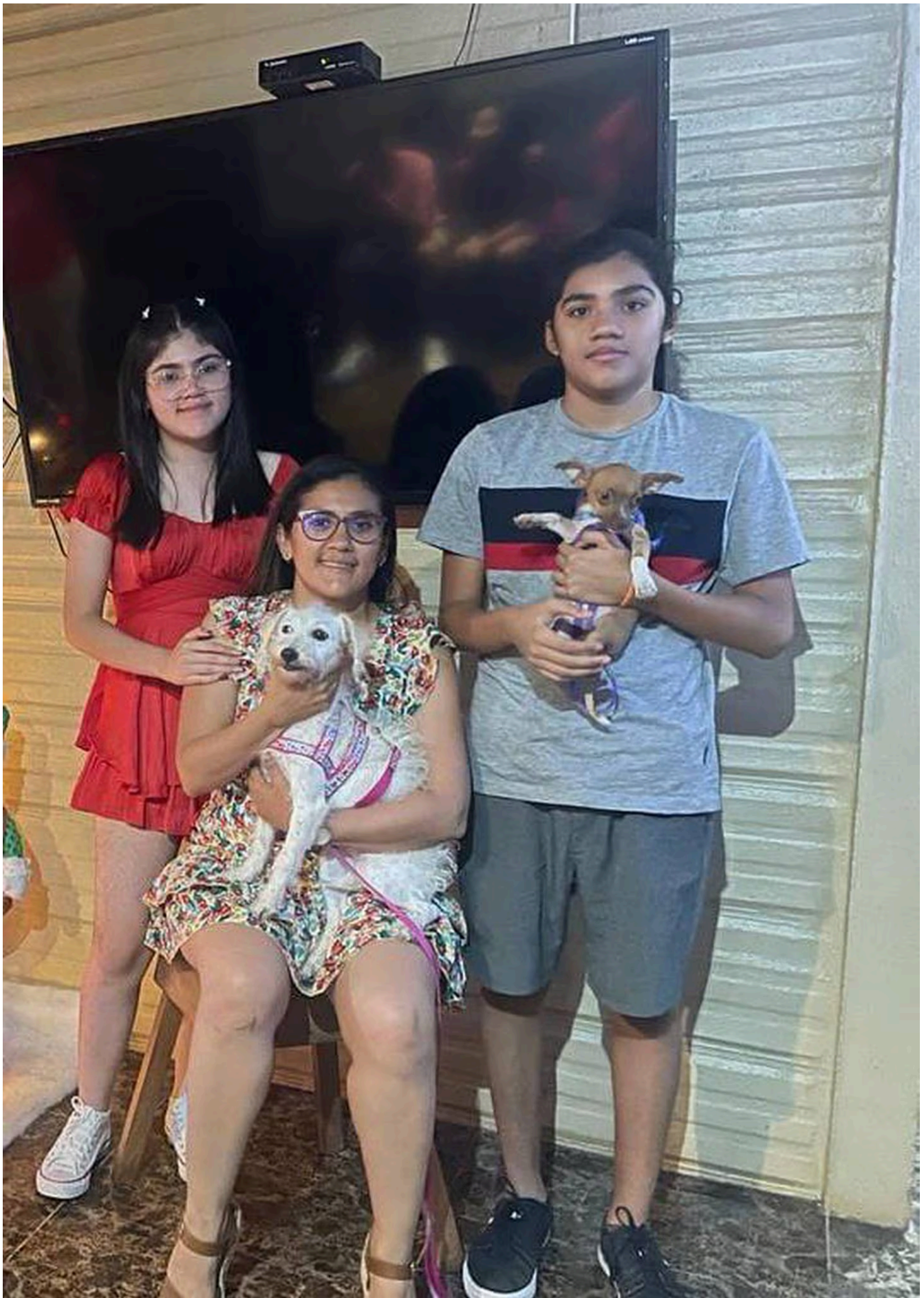
Sus hijos son el motor para seguir venciendo barreras.