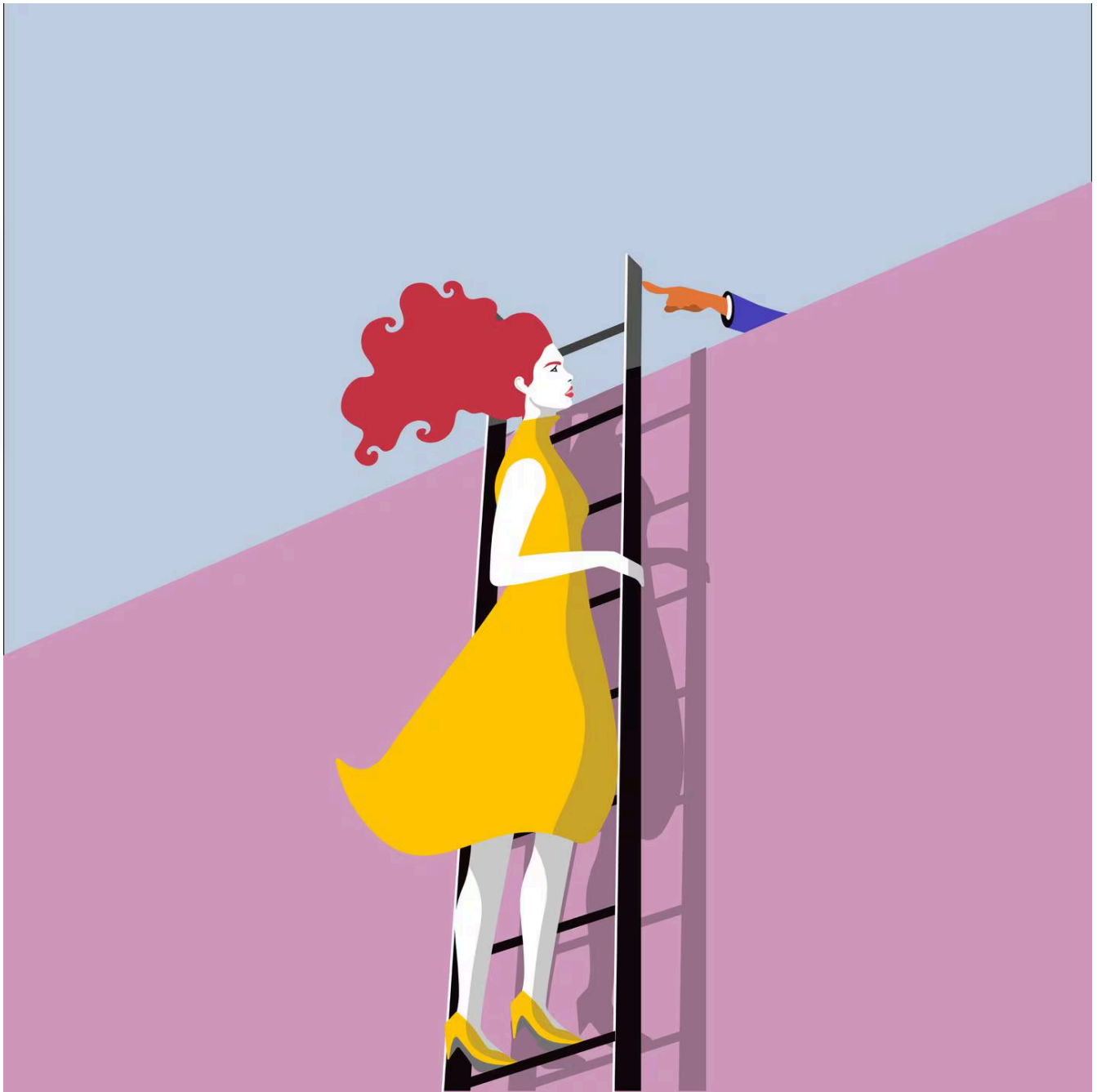
Estudios documentan que las mujeres tienen menos probabilidades que los hombres de ascender a altos cargos ejecutivos.