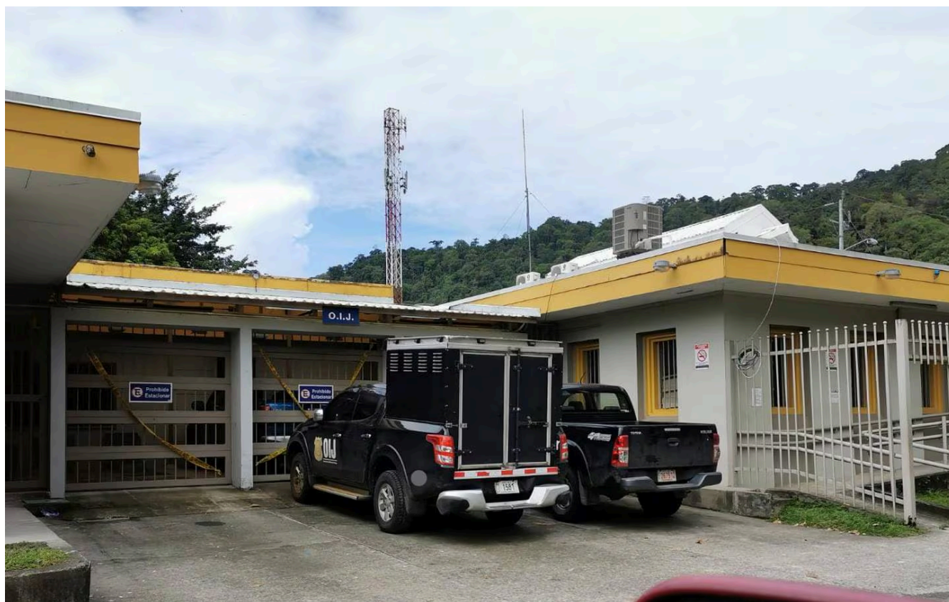
El caso del feminicidio se atendió en la delegación del Organismo de Investigación Judicial de Bribri, en Tamanca.

La víctima declinó hacerle caso al sujeto y se retiró sola. Sin embargo, horas después, cuando llegó a su casa, en barrio San José de Sixaola, descubrió que la vivienda había sido quemada. Además, el carro, cuya propiedad compartía con el sospechoso, también apareció incendiado en una finca agrícola cercana. El sospechoso quedó detenido.