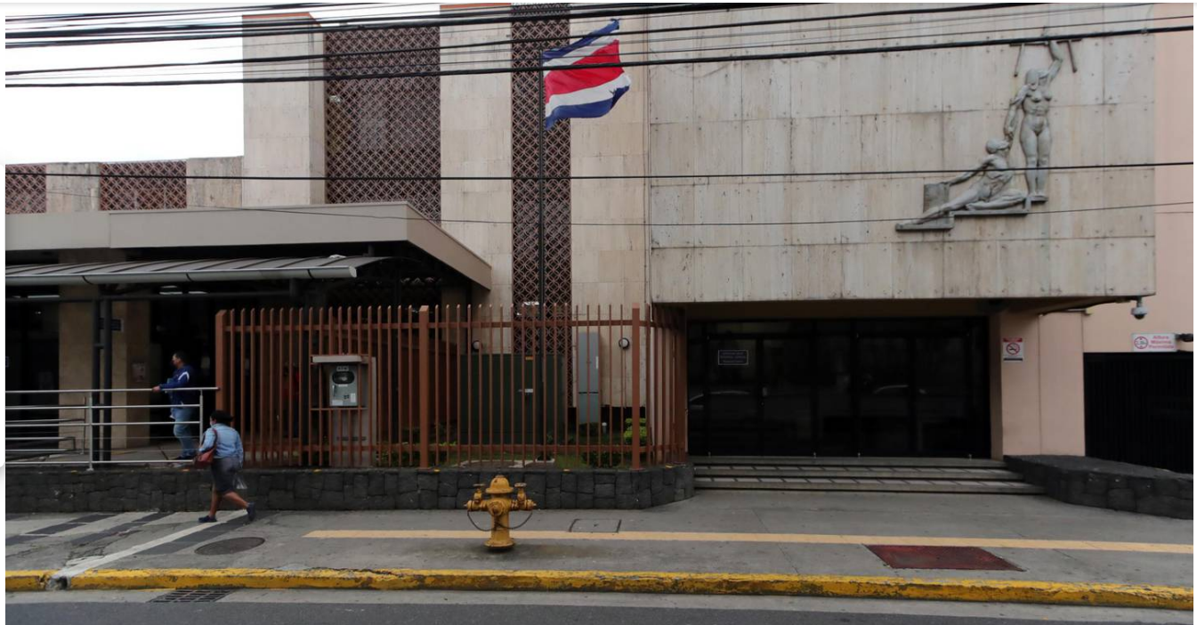
La sentencia fue dictada en los tribunales de Heredia.

Un hombre de apellidos Flores Mercado fue condenado a 45 años de cárcel por violar y robarle a una mujer.