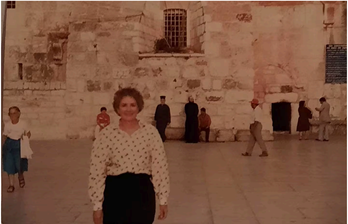
Julieta Pinto fue una escritora notable y reconocida, de un alto nivel estético.

Fueron enfáticos en analizar El despertar de Lázaro , obra que según explicaron mostró a Pinto como una escritora dotada de una dimensión filosófica indudable que llegó a la madurez existencial e intelectual que le permitió cuestionar la tradición religiosa ante el dilema del dolor y la muerte.