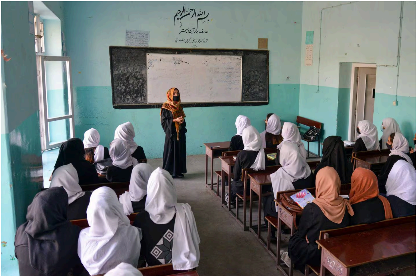
En esta foto de archivo tomada el 23 de marzo de 2022, las niñas asistían a una clase después de la reapertura de su escuela en Kabul.