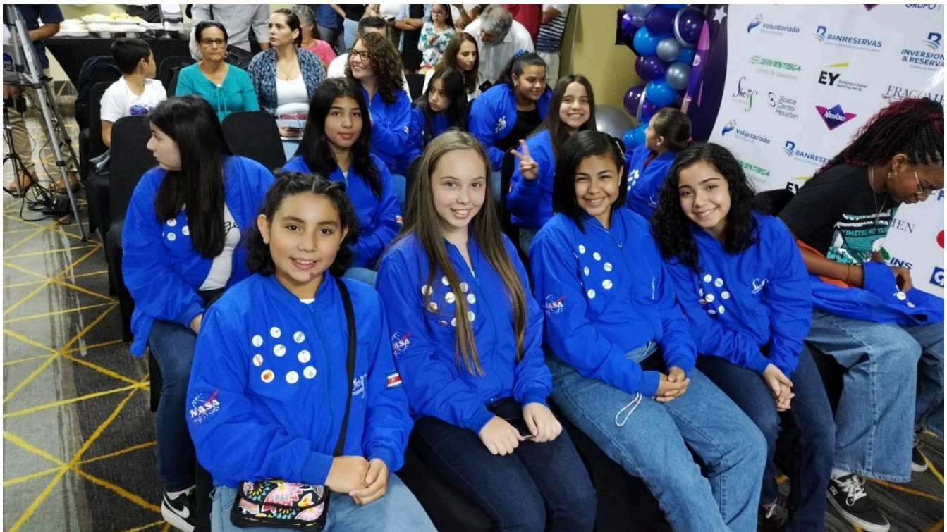
Las ticas están que no se cambian por nadie.

Igualmente, recibieron charlas de alto impacto con grandes empresarias e hicieron proyectos sostenibles con impacto social en sus territorios, aplicando habilidades y conocimiento en áreas